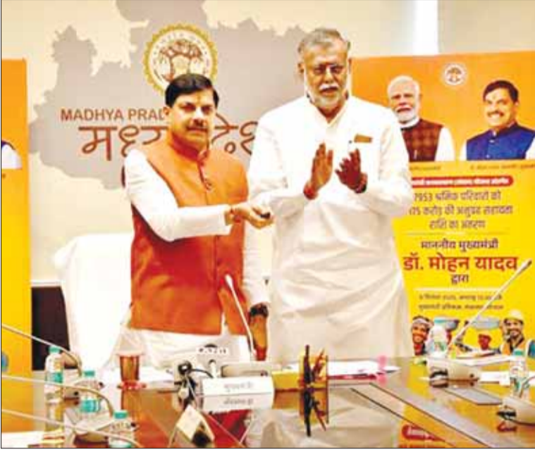
करोड़ 77 लाख से अधिक श्रमिक इस योजना में पंजीकृत हैं। पंजीयन की प्रक्रिया लगातार जारी है। इस अवसर पर पंचायत और ग्रामीण विकास तथा श्रम मंत्री प्रहलाद पटेल उपस्थित थे। कार्यक्रम से सभी जिले को सूचित किया गया।

भोपाल मुख्यमंत्री डॉ मोहन यादव ने कहा है कि हमारी संस्कृति में मान्यता है कि परहित सरिस धर्म नहीं भाई यानी दूसरों की सेवा से बड़ा कोई धर्म नहीं है और संबल योजना दूसरों की सेवा करने की इसी भावना को चरितार्थ करने का मार्ग है। राज्य सरकार को इस पहल का ही परिणाम है कि संबल योजना सच्चे अर्थों में श्रमिक भाई बहनों का सहारा बनी हुई है। मुख्यमंत्री डॉ यादव मंगलवार को मंत्रालय से संबल योजना के 7 हजार 953 हितग्राहियों के खातों में 175 करोड़ रुपये अंतरित कर संबोधित कर रहे थे। मुख्यमंत्री डॉ यादव ने कहा कि मुझे पूरा भरोसा है कि यह राशि श्रमिक भाई बहनों के लिए बड़ी मदद साबित होगी। प्रदेश में 1