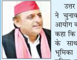
उत्तर प्रदेश के पूर्व मुख्यमंत्री अखिलेश यादव ने चुनाव सुधारों पर चर्चा के दौरान निर्वाचन आयोग की निष्पक्षता पर सवाल खड़े किए। उन्होंने कहा कि रामपुर में हुए उपचुनाव के दौरान आयोग के साथ-साथ स्थानीय पुलिस-प्रशासन की भूमिका भी कटपरे में रही। वोटिंग के दिन पुलिस-प्रशासन की कार्यवाही का जिक्र करते हुए अखिलेश ने दावा किया, भाजपा सरकार के साथ-साथ पुलिस-प्रशासन इस बात की कोशिश में लगी थी कि मतदाताओं को घर से निकलने न दिया जाए। इसकी सूचना निर्वाचन आयोग को दिए जाने के बावजूद कार्यवाही नहीं की गई।