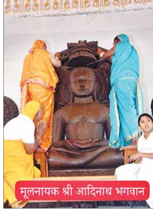
मूलनायक श्री आदिनाथ भगवान