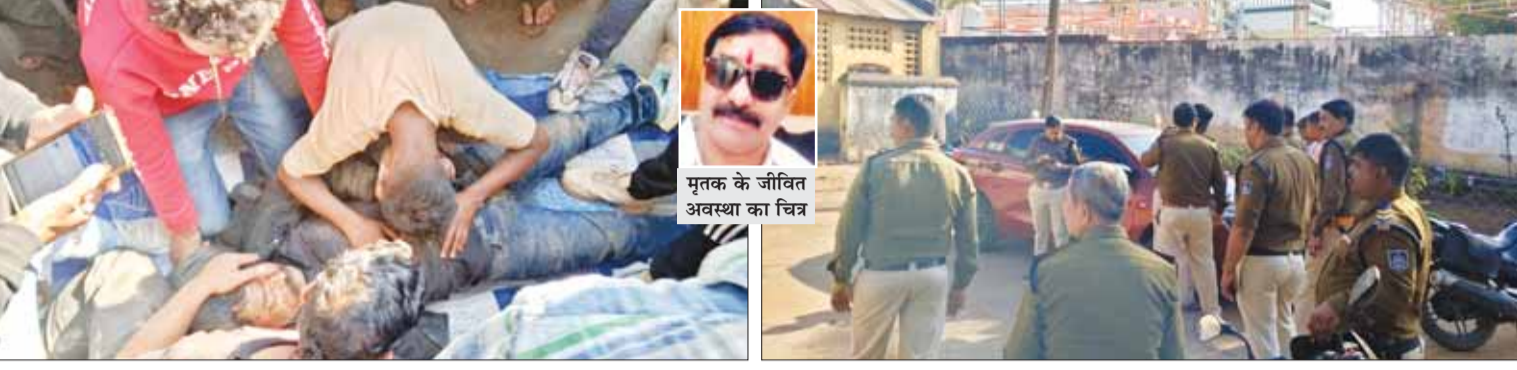
मृतक के जीवित अवस्था का चित्र

खितौला में वारदात से मचा हड़कंप, जांच में जुटी पुलिस