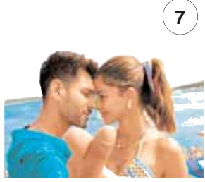
तू मेरी, मैं तेरा...अनएक्सपेक्टेड...