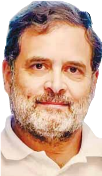
नई दिल्ली (वार्ता)

लोकसभा में विपक्ष के नेता राहुल गांधी ने सरकार पर तीखा हमला करते हुए कहा है कि उसने संसदीय परंपराओं को ध्वस्त कर मनरेगा की जगह लेने वाला 'वीवी जी राम जी' विधेयक संसद में जबरदस्ती पारित कर करोड़ों लोगों की उम्मीदों पर पानी फेरा है इसलिए कांग्रेस पार्टी सरकार के इस कदम के खिलाफ लड़ेगी और राष्ट्रत्यापी मोर्चा बनाएगी। राहुल गांधी ने कहा कि ग्रामीण भारत की उम्मीदों को खत्म करने वाली सरकार की इस योजना को कामयाब नहीं होने देंगे और