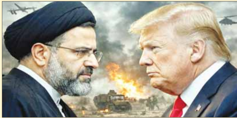
कम विकल्प बचे हैं। ट्रंप को लगता था कि 38 दिनों की भीषण बमबारी और 13 हजार ठिकानों को तबाह करने के बाद ईरान डर जाएगा और उनको बात मान लेगा, लेकिन ईरान ने साफ कर दिया कि चाहे कितना भी बारूद क्यों न बरस जाए, वो झुकने वाला नहीं है।

और 13 हजार ठिकानों को तबाह करने के बाद ईरान बात मान लेगा, लेकिन ऐसा नहीं हुआ। वेंस इस्लामाबाद से खाली हाथ वापस लौट आए हैं। ऐसे में सबसे बड़ा सवाल यही है कि अब आगे क्या? क्या फिर से बम बरसेंगे या बातचीत का कोई और रास्ता निकलेगा? असल में सारा मामला वहीं आकर अटक गया है जहां फरवरी में अटका था। वेंस ने ईरान के सामने साफ कह दिया कि यह हमारा आखिरी ऑफर है, इसे मानो या छोड़ दो। अमेरिका चाहता है कि ईरान अपना परमाणु प्रोग्राम हमेशा के लिए बंद कर दे। लेकिन ईरान ने दो टुक कह दिया कि उन्हें यह मंजूर नहीं है। वेंस ने पत्रकारों से कहा, हमने अपनी लक्ष्य रेखा साफ कर दी थी, लेकिन उन्होंने हमारी शर्त मानने से इनकार कर दिया। इस बातचीत के फेल होने के बाद अब ट्रंप प्रशासन के सामने बहुत ही