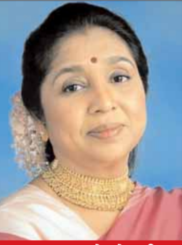
प्रसंगवश: आशा भोसले का निधन