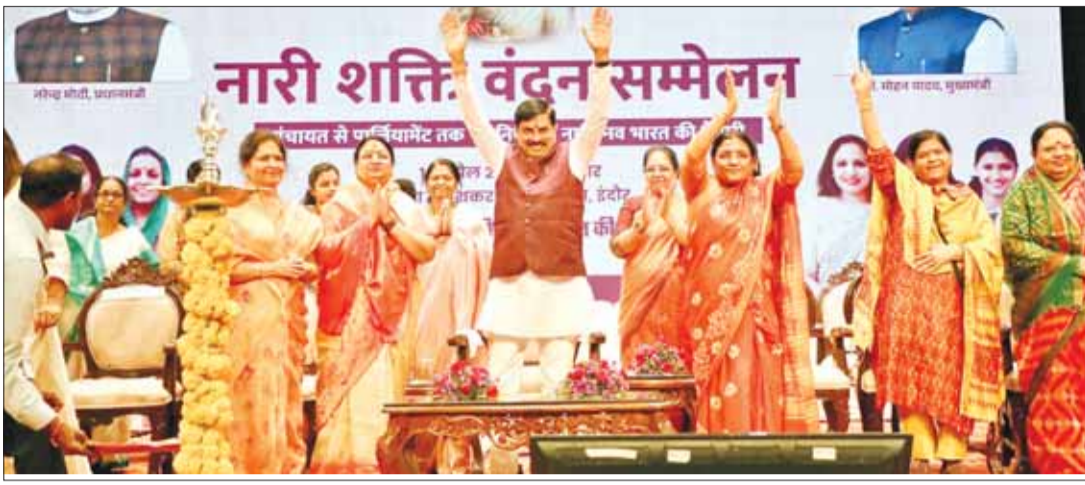
यशोदा माता, पद्माधाय, अहिल्याबाई, रानी दुर्गावती का उत्कृष्ट व्यक्तित्व अमर

मुख्यमंत्री डॉ. मोहन यादव ने कहा कि प्रधानमंत्री नरेन्द्र मोदी के नेतृत्व में देश तेजी से विकास और प्रगति के पथ पर अग्रसर है। वर्ष 2047 में भारत को विकसित राष्ट्र बनाना है। प्रधानमंत्री श्री मोदी महिलाओं के हित में लगातार निर्णय लेकर महिलाओं को अधिकार देने के साथ उन्हें सशक्त बना रहे हैं। मुख्यमंत्री डॉ. यादव ने कहा कि डॉ. अंबेडकर की पहल को आगे बढ़ाते हुए प्रधानमंत्री श्री मोदी ने नारी शक्ति को लोकसभा और विधानसभाओं में 33 प्रतिशत आरक्षण दिलवाने का संकल्प लिया है। यह 21वीं शताब्दी का सबसे बड़ा निर्णय है। इस अधिनियम के लागू हो जाने के बाद नारी शक्ति का तेजी से सशक्तिकरण होगा। मुख्यमंत्री डॉ. यादव मंगलवार को इंदौर के परस्पर नगर स्थित लता मंगेशकर ऑडिटोरियम में आयोजित नारी शक्ति वंदन सम्मेलन को संबोधित कर रहे थे। मुख्यमंत्री डॉ. यादव ने कहा कि प्रधानमंत्री श्री मोदी ने सुप्रीम कोर्ट के निर्णयों का पालन करते हुए मुस्लिम महिलाओं को तीन तलाक से मुक्ति दिलाकर उनके हित में नया इतिहास लिखा, तो वहीं अयोध्या में भगवान श्रीराम का भव्य मंदिर बनाया। मुख्यमंत्री डॉ. यादव ने कहा कि इंदौर देवी अहिल्याबाई का शहर है और स्वर कोकिला लता मंगेशकर की जन्मस्थली है। आज हम जिस सभागृह में उपस्थित हैं वह लता मंगेशकर की स्मृति में बनाया गया है।