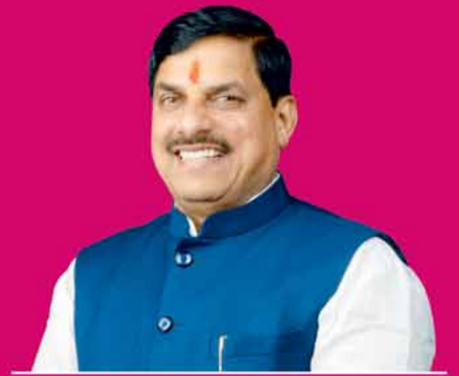
डॉ. मोहन यादव मुख्यमंत्री, मध्यप्रदेश