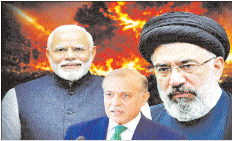
तनाव की सबसे बड़ी वजह बताया। लेकिन कारार दिया जो तीसरे विश्व युद्ध को रोक साध ही भारत, रूस और चीन को वो त्रिमूर्ति सकती है। ईरान ने भारत को सिर्फ एक देश