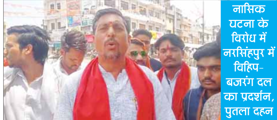
नासिक घटना के विरोध में नरसिंहपुर में विहिप-बजरंग दल का प्रदर्शन, पुतला दहन