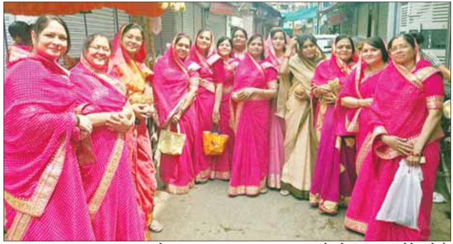
गाडरवारा (स्वतंत्र मत)।

जैसा की ज्ञात है अक्षय तृतीया के दिन प्रथम जैन तीर्थंकर भगवान ऋषभदेव को एक वर्ष तक आहार की विधि नही मिली थी और उनके द्वारा इन दिनों उपवास किया गया एक वर्ष के बाद राजा श्रेयांस और उनके भाई के द्वारा भगवान की आहार विधि मिलने पर उन्हें सबसे पहले इक्षु रस (गन्ने का रस) का आहार