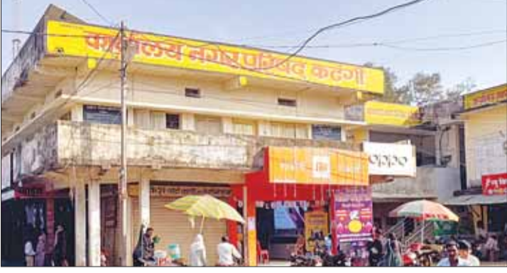
बालाघाट/कटंगी (स्वतंत्र मत)

इंजीनियर की मौज, विधायक के हाथों की कठपुतली बने पार्षद