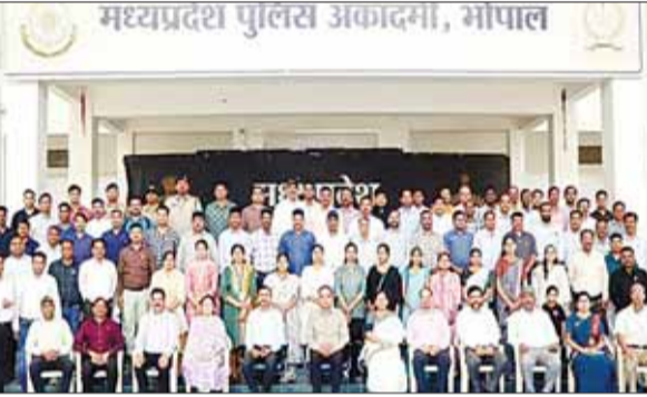
मध्यप्रदेश पुलिस अकादमी, भोपाल

मप्र पुलिस अकादमी भौरी में कार्यालयीन प्रक्रिया एवं सेवा प्रावधानों पर दो दिवसीय सेमिनार