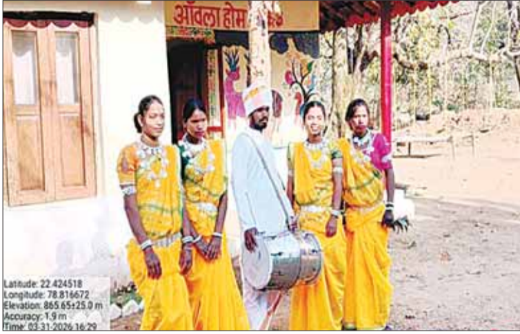
पर्यटकों को खुशियां देने के साथ उनके परिवारों में भी खुशियां आ गई।

मध्यप्रदेश की ग्रामीण संस्कृति के इन्द्रधनुषी रंगों को करीब से देखना और ज्यादा आनंददायी और रोमांचक हो गया है। बड़ी संख्या में बन रहे होम-स्टे में आने वाले पर्यटकों की संख्या लगातार बढ़ रही है। प्रदेश में हाई-वे और प्राकृतिक स्थानों के आस-पास के तथा जनजातीय क्षेत्रों में अब बड़ी संख्या में होम-स्टे नजर आ जा रहे हैं। मुख्यमंत्री डॉ. मोहन यादव ने ग्रामीण उदयमिता को बढ़ावा देते हुए ग्रामीण पर्यटन की असीम संभावनाओं का दोहन करने की नीति बनाई है। पिछले दो सालों में इससे ग्रामीण अंचलों में रोजगार के बड़े अवसर निर्मित हुए हैं। होम-स्टे से देशी-विदेशी पर्यटकों को ग्रामीण संस्कृति के दर्शन और सहजता से सुलभ हो गया है। प्रदेश में 98 चुने गांवों में 346 होम-स्टे ग्रामीणों द्वारा संचालित किए जा रहे हैं, जबकि 642 होम-स्टे निर्माणाधीन हैं, जो जल्दी ही पर्यटकों के आतिथ्य के लिए तैयार हो जायेंगे। अब तक लगभग 34 हजार देशी-विदेशी पर्यटकों ने होम-स्टे कर ग्रामीण जीवन का प्रत्यक्ष अनुभव लिया। सुखद आवास सुविधा, परम्परागत व्यंजन का स्वाद, स्थानीय लोक-कला, नृत्य-संगीत, हस्त-कला, हस्त-शिल्प से होम-स्टे संचालक परिवारों को 6.76 करोड़ की आय प्राप्त हुई। उन्हें आय का एक गरिमापूर्ण साधन मिल गया।