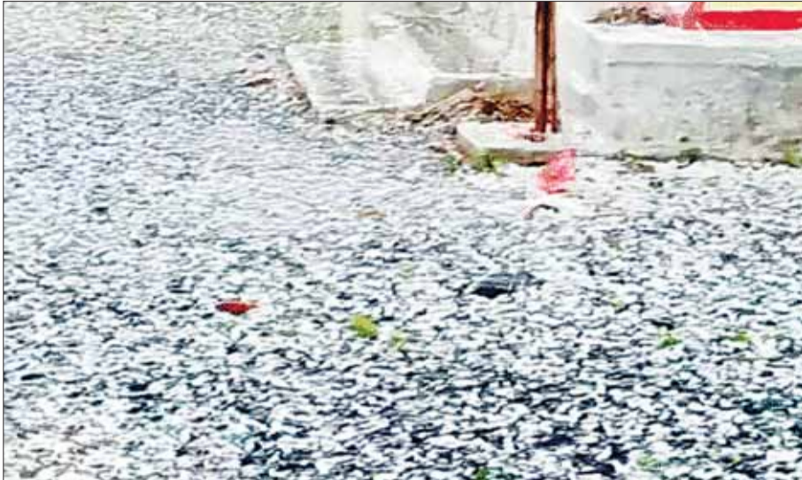
भोपाल (स्वतंत्र मत)

मध्य प्रदेश में मौसम का मिजाज अचानक बदल गया है। बैतूल और ग्वालियर में शनिवार शाम तेज ओलावृष्टि हुई, जबकि प्रदेश के 45 जिलों में आंधी-बारिश का अलर्ट जारी है। सिवनी और रीवा में आकाशीय बिजली गिरने से चार लोगों की मौत हो गई है। आज भी कई जिलों में बारिश का दौर जारी रहने में तेज आंधी और बारिश हो सकती है। प्रदेश के बीच से एक टर्फ गुजर रही है, जबकि ऊपरी हिस्से में दूसरी टर्फ सक्रिय है। वहीं पश्चिमी और उत्तरी हिस्सों में दो चक्रवाती सिस्टम भी बने हुए हैं। शनिवार को ग्वालियर में शाम करीब 4 बजे अचानक मौसम बदल