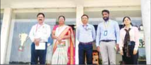
शैक्षिक स्वास्थ्य का आकलन भी किया गया। आकलन के पश्चात एनसीईआरटी द्वारा बच्चों के प्रदर्शन का विश्लेषण करते

कटनी (स्वतंत्रमत)। कलेक्टर कटनी के मार्गदर्शन एवं सीईओ जिला पंचायत कटनी के निर्देशन में फाउंडेशनल लर्निंग स्टडी (एफएलएस) के मुख्य आकलन हेतु डाइट कटनी के फील्ड इन्वेस्टिगेटर द्वारा जिले में एनसीईआरटी द्वारा चयनित नौ विद्यालयों में कक्षा 3 के कुल दर्ज 160 विद्यार्थियों में से 86 विद्यार्थियों का आकलन किया गया। उक्त स्टडी के अंतर्गत कक्षा 3 के विद्यार्थियों का हिंदी एवं अंग्रेजी भाषा विकास तथा गणित की बुनियादी दक्षताओं में आकलन किया गया है। साथ ही शिक्षक तथा छात्र प्रश्नावली का उपयोग करते हुए स्कूलों के