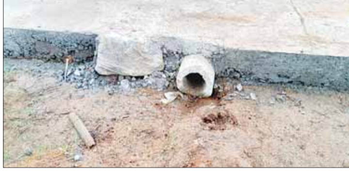
विभाग के द्वारा कराया गया है।

जानकारी अनुसार, तेदुपता मद से सत्र 2022-23 में कोडुमी के आवासटोला में दो सीसी सड़क की स्वीकृती कराई गई है, जिसका निर्माण कार्य वर्ष 2025 में ही पूरा किया गया है, जिसकी लम्बाई 270 मीटर सड़क है और लागत 18 लाख रूपए से अधिक की है। आदिवासी ग्राम होने के नाते वन विभाग के अधिकारी, कर्मचारी के द्वारा उक्त निर्माण कार्य में अदेखी की गई है। यहीं नहीं उक्त सड़क निर्माण कार्य में रेत सप्लायर, सीमेंट सप्लायर और गिट्टी सप्लायर सब अलग-अलग व्यक्ति हैं और निर्माण कार्य अध्यक्ष के निगरानी में वन