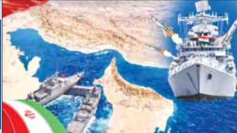
की खाड़ी) में फंसे हुए हैं। इनमें एलएनजी, एलपीजी, कच्चे तेल के वाहक, कंटेनर पोत और ड्रेजर तथा रासायनिक पदार्थ ले जाने वाले जहाज शामिल हैं। एलपीजी पोत 'जग विक्रम'

पश्चिम एशिया में हालिया तनाव और सीजफायर के बाद रणनीतिक रूप से महत्वपूर्ण होर्मुज स्ट्रेट से समुद्री आवाजाही फिर से शुरू होने की उम्मीद है। हालांकि, 5 अप्रैल के बाद से अब तक कोई भी भारतीय-ध्वज वाला जहाज होर्मुज को पार नहीं कर पाया है। सुत्रों के अनुसार, भारतीय नौसेना वर्तमान में हालात पर बारीकी से नजर बनाए हुए है और सुरक्षा सुनिश्चित होने के बाद ही जहाजों को आगे बढ़ने की अनुमति दी जाएगी। वर्तमान में 16 भारतीय झंडे वाले जहाज होर्मुज के पश्चिमी हिस्से (फारस