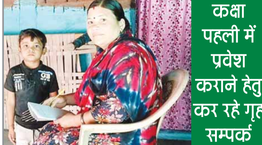
गाडरवारा (स्वतंत्र मत)। 1

गाडरवारा (स्वतंत्र मत)। अध्यापक शिक्षक संयुक्त मोर्चा मध्यप्रदेश के प्रांतीय आह्वान पर टीईटी अनिवार्यता के विरोध स्वरूप एवं प्रथम नियुक्ति दिनांक से वरिष्ठा दिए जाने को लेकर अध्यापक संयुक्त मोर्चा विकासखंड साईंखेड़ा, चीचली इकाइयों द्वारा संयुक्त रूप से तहसील मुख्यालय गाडरवारा में मुख्यमंत्री मध्यप्रदेश एवं स्कूल शिक्षामंत्री मध्यप्रदेश के नाम से एएसडीएम को आज ज्ञापन सौंपा जायेगा, संयुक्त मोर्चा द्वारा सभी अध्यापक/ शिक्षक साथियों से धरना ज्ञापन में उपस्थित होकर अपनी आवाज को पुरजोर तरीके से शासन तक पहुंचाने का आग्रह किया गया है, धरना आज दिनांक 11 अप्रैल को दोपहर दो बजे से पांच बजे तक पलोटन गंज में आयोजित है तथा धरने के बाद ज्ञापन सौंपा जायेगा।