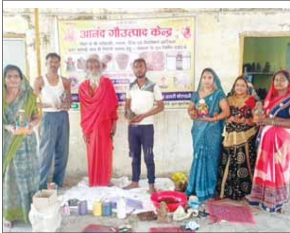
उत्पाद पूरी तरह से प्राकृतिक, सुरक्षित और स्वास्थ्य के लिए लाभकारी माने जाते हैं। कार्यक्रम का आयोजन एवं प्रेरणा स्थल

स्थानीय स्तर पर गौ-आधारित उत्पादों को बढ़ावा देने और स्वदेशी परंपराओं के संरक्षण हेतु आनंद गोउत्पाद केन्द्र द्वारा एक सराहनीय पहल की जा रही है। केन्द्र के माध्यम से गोबर से निर्मित श्री गणेश जी की प्रतिमाएं, गमले, दीये एवं विभिन्न प्रकार के डेकोरेशन आर्टिकल्स उपलब्ध कराए जा रहे हैं। इसके साथ ही हवन सामग्री और गोमूत्र से निर्मित स्वास्थ्यवर्धक उत्पाद भी लोगों तक पहुंचाए जा रहे हैं। इस पहल का उद्देश्य न केवल पर्यावरण संरक्षण को बढ़ावा देना है, बल्कि लोगों को प्राकृतिक एवं पारंपरिक उत्पादों के उपयोग के प्रति जागरूक करना भी है। गोबर और गोमूत्र से बने ये