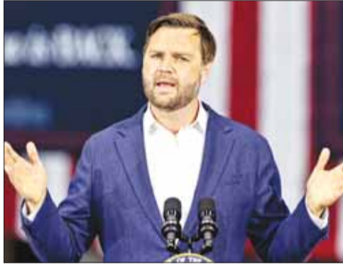
प्रवाह सामान्य हो जाएगा। साथ ही इस बात का डर भी है कि अगर शांतिवार्ता फेल हो जाती है तो हालात अभी से ज्यादा बिगड़ सकते हैं। इस्लामाबाद में यह शांति वार्ता शनिवार को होगी। इस बैठक को 'इस्लामाबाद टॉक्स' कहा जा रहा है। पाकिस्तान, ईरान का पड़ोसी देश है साथ ही उसके अमेरिका

नई दिल्ली। अमेरिकी उपराष्ट्रपति जेडी वेंस शुक्रवार शाम पाकिस्तान के लिए रवाना हो गए हैं। ईरान-अमेरिका युद्धविराम पर इस्लामाबाद में होने वाली शांतिवार्ता से पहले जेडी वेंस ने बड़ा बयान दिया है। वेंस ने कहा कि वह ईरान के साथ पॉजिटिव बातचीत की उम्मीद कर रहे हैं। पाकिस्तान रवाना होने से पहले वेंस ने पत्रकारों से कहा, हम बातचीत का इंतजार कर रहे हैं। मुझे लगता है कि यह पॉजिटिव होगा। जैसा कि राष्ट्रपति ट्रंप ने कहा है कि अगर ईरानी अच्छे भरोसे के साथ बातचीत करने को तैयार हैं, तो हम दोस्ती का हाथ बढ़ाने को तैयार हैं। और अगर वे हमारे साथ खिलवाड़ की कोशिश करेंगे, तो हम उसे स्वीकार करने के लिए बिलकुल तैयार नहीं हैं। इस्लामाबाद में होने वाली इस महत्वपूर्ण बैठक पर पूरी दुनिया की नजर है। अगर यह वार्ता कामयाब रही तो मिडिल ईस्ट की जंग पर आखिरकार ब्रेक लगेगा। होर्मुज संकट खत्म होने से तेल का रास्ता का रास्ता साफ हो जाएगा। कच्चे तेल की कीमत घट जाएगी और वैश्विक ऊर्जा का