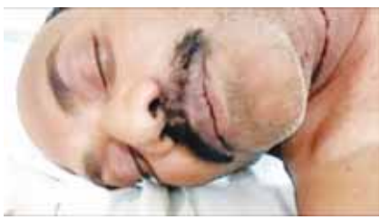
जबलपुर (स्वतंत्र मत)।

अलग-अलग क्षेत्रों में हुई जानलेवा वारदातें, जांच में जुटी पुलिस