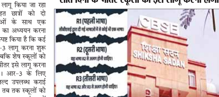
केंद्रों। खास बात यह है कि कक्षा छह में जो आर-3 भाषा शुरू की जाएगी, वही आगे कक्षा नौ-10 में विकल्प के रूप में उपलब्ध होगी। सीबीएसई ने कक्षा नौ से 'इंग्लिश

सात दिनों के भीतर स्कूलों को इसे लागू करना होगा