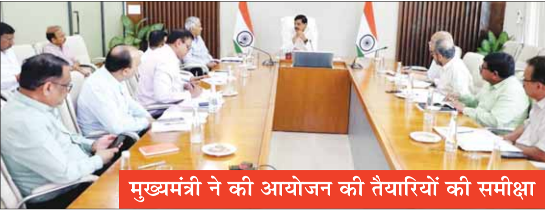
मुख्यमंत्री ने की आयोजन की तैयारियों की समीक्षा

मुख्यमंत्री डॉ. मोहन यादव ने कहा है कि कृषि हमारी जीवन संस्कृति का मूल आधार है। किसान अन्नदाता होने के साथ हमारी संस्कृति, परम्पराओं और सुरक्षित भविष्य का आधार स्तम्भ हैं। किसान अपने परिवार के लिए ही नहीं, पूरे समाज के लिए अन्न का उत्पादन करता है। किसान मनुष्यों के साथ पशु-पक्षियों और कीट-पतंगों का भी उदर-पोषण करता है। ऐसे अन्नदाता के जीवन में आनंद और उत्सव का संचार करना हमारा दायित्व है। उन्होंने कहा कि मध्यप्रदेश सरकार यह वर्ष किसान कल्याण वर्ष के रूप में मना रही है। कृषि लोकरंग-2026 इसी दिशा में एक महत्वपूर्ण पहल है। मुख्यमंत्री डॉ. यादव शुक्रवार को मुख्यमंत्री निवास (समत्व भवन) में प्रदेश में कृषि लोकरंग - 2026 आयोजन की तैयारियों की समीक्षा बैठक को संबोधित कर रहे थे। उन्होंने अधिकारियों को निर्देश दिए कि यह आयोजन किसानों के जीवन, उनकी पुरा परम्पराओं और कृषि संस्कृति का जीवंत उत्सव बने। उन्होंने कहा कि जो दिन-रात अथक श्रम-साधना कर सबके उदर पोषण की चिंता करता है, उसके परिश्रम से भरे जीवन में खुशियों के सुनहरे रांग भरना हम सबका कर्तव्य है। मुख्यमंत्री ने कहा कि कृषि लोकरंग में किसानों और आमजन की सहभागिता बढ़ाने के लिए कृषि किज प्रतियोगिता जैसे नवाचार किए जाएं। प्रतियोगिता के विजेताओं को पुरस्कार भी दिए जाएं। प्रत्येक जिले के प्रथम विजेता (टापर) को पुरस्कार के रूप में किसानों