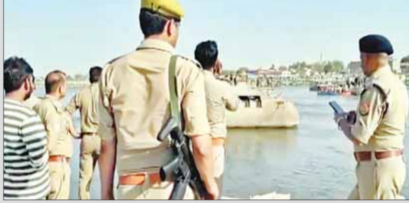
यह अथाह दुःख सहन करने की शक्ति तथा चायलों को शौच स्वास्थ्य लाभ प्रदान करें।