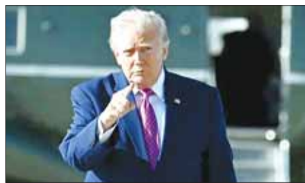
उन पर 50 प्रतिशत टैरिफ लगा दिया जाएगा।

अमेरिका-ईरान के बीच तनाव अभी थमा भी नहीं था कि राष्ट्रपति डोनाल्ड ट्रंप ने अब चीन के साथ भी नया टकराव मोल ले लिया है। खबर है कि चीन अगले कुछ हफ्तों में ईरान को नए एयर डिफेंस सिस्टम मुहैया कराने की तैयारी कर रहा है। जिसे लेकर ट्रंप बौखला गये हैं। ट्रंप से साफ पूछा गया कि क्या चीन भी उन देशों की लिस्ट में शामिल है, जिन पर ईरान को सैन्य मदद देने पर 50 प्रतिशत का भारी टैरिफ लगाया जा सकता है। ट्रंप ने बिना किसी हिचकिचाहट के जवाब दिया, हां, और दूसरे भी, लेकिन हां...चीन भी। ट्रंप ने इन रिपोर्टों को 'फेक' करार देते हुए खारिज कर दिया। फिर भी उन्होंने चेतावनी देते हुए कहा, अगर ये खबरें सच निकलें, तो चीन को बहुत भारी टैरिफ का सामना करना पड़ेगा। मेरे लिए एक खबर का ज्यादा मतलब नहीं होता, क्योंकि ज्यादातर खबरें फेक होती हैं। लेकिन मैंने सुना है कि चीन ईरान को शोल्डर-लॉन्ड मिसाइलें देने की सोच रहा है। मुझे शक है कि वे ऐसा करेंगे। मेरे और चीन के रिश्ते अच्छे हैं। शुरू में शायद उन्होंने थोड़ा बहुत किया हो, लेकिन अब मुझे नहीं लगता। ट्रंप ने सख्त लहजे में कहा, लेकिन अगर हम उन्हें पकड़ लिए कि वे ईरान को हथियार दे रहे हैं, तो