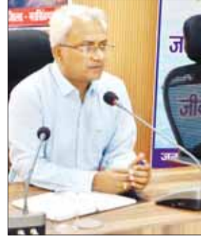
केन्द्रों का लक्ष्य आवंटित किया गया है, जिनमें से 5x केन्द्र

उन्होंने जल गंगा संवर्धन अभियान के तहत जिले में आयोजित गतिविधियों को बढ़ाने के निर्देश दिए, जिससे जल संरक्षण के प्रयासों को व्यापक रूप दिया जा सके। बैठक में गेहूँ उपार्जन की भी विस्तृत समीक्षा की गई। समीक्षा के दौरान बताया गया कि जिले को शासन द्वारा 69 खरीदी