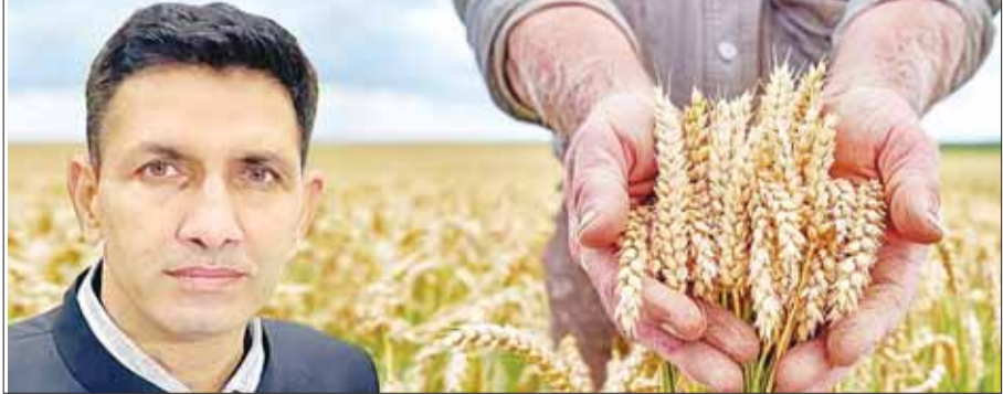
उन्होंने सवाल उठाया कि क्या यही 'कृषि कल्याण वर्ष' की वास्तविकता है, जहां पहले खरीदी में देरी हुई और

भोपाल (स्वतंत्र मत) एमपी में गेहूं खरीदी देरी से शुरू होने को लेकर एक तरफ राजनीति हो रही है। वहीं दूसरी तरफ जब खरीदी शुरू हुई है तो ई-उपार्जन पोर्टल पर सैटेलाइट सत्यापन में किसानों की फसल गेहूं के बजाए दूसरी दिख रही है। इन गड़बड़ियों को लेकर सियासत तेज हो गई है। प्रदेश कांग्रेस अध्यक्ष जीतू पटवारी ने मुख्यमंत्री डॉ. मोहन यादव को पत्र लिखकर आरोप लगाया है कि तकनीकी खामियों के कारण हजारों किसान खरीदी प्रक्रिया से बाहर हो रहे हैं और आर्थिक संकट झेलने को मजबूर हैं। पत्र में किसानों की वर्तमान स्थिति का जिक्र करते हुए पटवारी ने लिखा कि कई परिवारों में शादी-ब्याह के खर्च अटके हैं, बच्चों की स्कूल फीस रुक गई है और किसान बैंक व साहूकारों के कर्ज की कितने चुकाने में असमर्थ हो रहे हैं। उन्होंने सवाल उठाया कि क्या यही 'कृषि कल्याण वर्ष' की वास्तविकता है, जहां पहले खरीदी में देरी हुई और