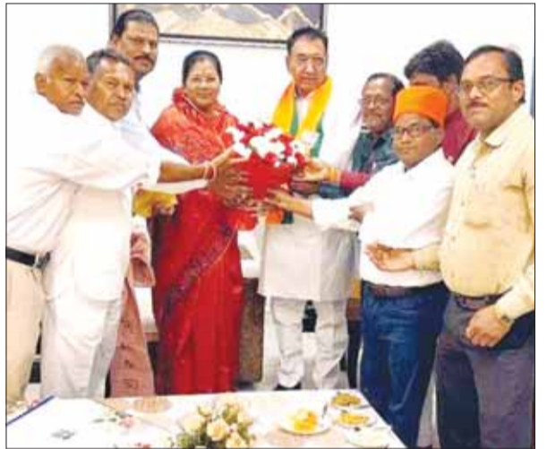
मण्डला (स्वतंत्रमत)। ढीमर मांझी समाज के वंशानुगत महुआरे जो कि अनेक वर्षों से सरकार की

योजनाओं से वंचित थे एवं मत्स्य पालन करने वाले तालाब में परेशानी को देखते हुए प्रदेश के