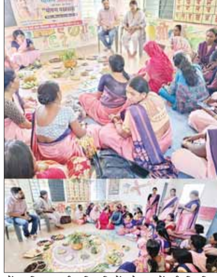
में उपस्थित सभी प्रतिभागियों को बच्चों की नियमित देखभाल, पोषण एवं विकासात्मक गतिविधियों पर विशेष ध्यान देने हेतु प्रेरित किया गया।

हालांकि पुलिस ने परिजनों के बयान के पश्चात नकद राशि मिलने का इंकार करने वाली पुलिस ने देर शाम एक लाख रुपए मिलने की बात स्वीकार की। अब परिजनों के बयान एवं पुलिस के द्वारा स्वीकार की गई एक लाख की राशि के बीच का मामला पुलिस की गले की फांस बन गई है अब देखा यह है कि इस मामले को लेकर पुलिस अधीक्षक कैसी जांच की प्रक्रिया अपनाते हैं और कैसे जनता के दिलों में अपनी साफ सुथरी छवि बना पाते हैं।