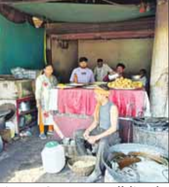
बंद करवा दिया। खाद्य पदार्थों में उपयोग किए जा रहे पके तेल और टमाटर चटनी के सैंपल जांच के लिए भेजे गए हैं।