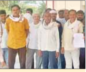
ग्राम रेवाड़ा में उपार्जन केंद्र शुरू करने किसानों की मांग

नैनपुर (स्वतंत्र मत)। विकासखंड नैनपुर के ग्राम रेवाड़ा में उपार्जन केंद्र शुरू करने के लिए किसानों ने मांग की है। इस हेतु अनुविभागीय अधिकारी को किसानों द्वारा एक ज्ञापन सौंपा गया है। किसानों का कहना है कि समर्थन मूल्य में रवि उपार्जन वर्ष 2026-27 में खरीदी का कार्य किया जा रहा था। ग्राम रेवाड़ा में दो केंद्र बनाए जाते थे। जिनके इस बार लेम्पस ने ग्राम रेवाड़ा में खरीदी के लिए आदेशित नहीं किया। जबकि खरीदी केंद्र रेवाड़ा क्षेत्र बड़ा है। जिसमें आसपास के लगभग 10 ग्राम के किसान अपनी फसल बेचने आते हैं। अपनी फसल लगभग 10 से 15 किलोमीटर दूर खरीदी केंद्र नैनपुर ले जाना पड़ेगा। किसानों का कहना है ग्राम रेवाड़ा को खरीदी केंद्र पुनः बनाया जाए जिससे आसपास के सभी किसान अपनी फसल का विक्रय समर्थन मूल्य में कर सकें।