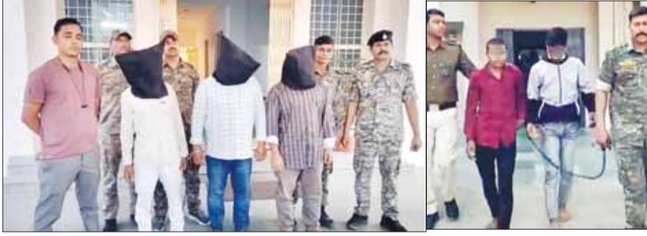
बालाघाट (स्वतंत्र मत)

जिले की रामपायली थाना पुलिस ने एक बार फिर अवैध मादक पदार्थों के खिलाफ विशेष अभियान के तहत कार्यवाही करते हुए बड़ी सफलता हासिल की है और अंतर्राज्यीय गांजा तस्करी नेटवर्क का पर्दाफाश किया है। थाना रामपायली पुलिस ने प्रारंभिक कार्रवाई में एक मोटरसाइकिल से 21 किलो गांजा बरामद कर पहले तीन आरोपियों को गिरफ्तार किया गया था। जिनमें दो आरोपी उड़ीसा राज्य का भी विश्वलेषण किया जा रहा है। वही उनके विरुद्ध मामला पंजीबद्ध कर मामले की गहन जांच के लिए एसआईटी गठित की गई। विवेचना के दौरान को गई पूछताछ में आरोपियों ने अवैध मादक पदार्थ तस्करी के एक बड़े अंतर्राज्यीय रैकेट का खुलासा