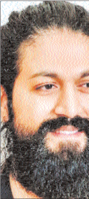
दक्षिण भारतीय फिल्मों के मेगास्टार यश ने अपनी बहुप्रतीक्षित फिल्म टॉक्सिक- ए फेयरीटेल फॉर ग्रोन-अप्स पर बात की है।

यश का कहना है कि फिल्म का स्केल बड़ा हो तो हर सीन में कुछ अलग तड़का होना चाहिए। हर सीक्वेंस में अलग स्टाइल, अलग फ्लेवर होना जरूरी है। उनके लिए एक्शन सिर्फ धुंआधार स्टंट नहीं, बल्कि फील होने वाला एक्सपीरियंस है एक्शन ऐसा होना चाहिए कि दर्द फील हो च मिरर न्यूॉरंस तक हिल जाएं, तब सिनेमा मज़ा देता है! यश ने कहा कि 'टॉक्सिक' सिर्फ एक्शन का तमाशा नहीं है, ये इमोशंस का डीप डाइव भी है। उन्होंने कहा, हम फिल्ममें क्यों देखते हैं? क्योंकि हम हर इमोशन अपनी जिंदगी में नहीं जी सकते। फिल्म के जरिए हम किसी और की जिंदगी जीते हैं, उनके दर्द और संघर्ष समझते हैं। इसी फिलॉसफी के साथ फिल्म में इंसानी जज्बातों के सबसे डाक और कॉम्प्लेक्स पहलुओं को पकड़ने की कोशिश की गई है। गीतू मोहनदास के निर्देशन में बनी इस फिल्म में नयनतारा, किथारा आडवाणी, हुमा कुरैशी, रुक्मिणी वसंत और तारा सुतारिया जैसे दमदार चेहरे नजर आएंगे। फिल्म टॉक्सिक 04 जून 2026 को रिलीज होगी।