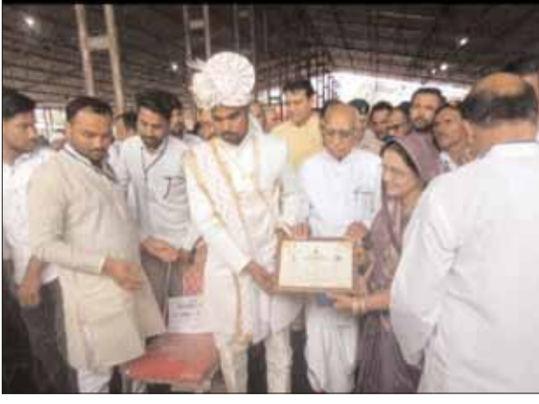
गाडरवारा (स्वतंत्र मत)