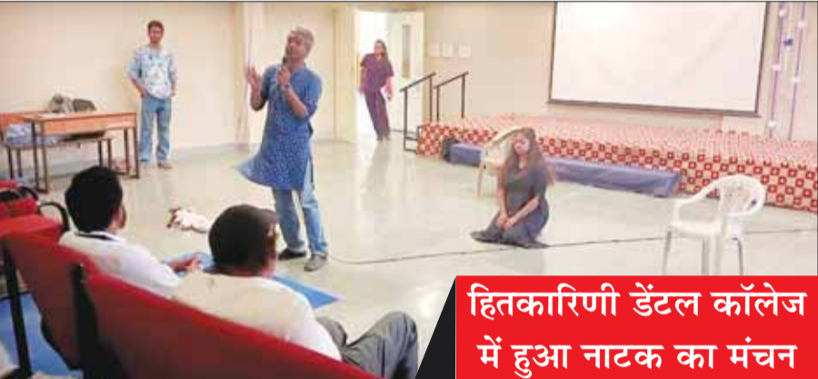
हितकारिणी डेंटल कॉलेज में हुआ नाटक का मंचन