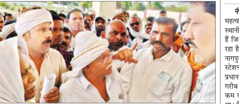
नैनपुर (स्वतंत्र मत)

नैनपुर क्षेत्र के बड़ी संख्या में किसान एकत्रित हो कर एसडीएम कार्यालय पहुंचे और अपनी समस्या जताते हुए एक ज्ञापन सोपकर प्रशासन को चेतावनी दिया है। किसानों का कहना है कि समस्या का त्वरित हल न हो पाने की दशा में सभी किसान आज 23 अप्रैल को सड़कों पर उतरकर आन्दोल करेंगे। जिसकी जिम्मेदारी प्रशासन की होगी। ज्ञापन में लेख किया गया है कि शासन के निर्देशानुसार 15 अप्रैल से गेहूं उपार्जन कार्य प्रारंभ होना था किंतु क्रांलिटी खराबी का हवाला देकर संबंधित अधिकारियों के द्वारा आज दिनांक तक खरीदी प्रारंभ नहीं