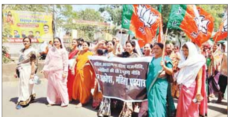
डिंडौरी (स्वतंत्र मत)

भारतीय जनता पार्टी महिला मोर्चा के नेतृत्व में बुधवार को जिला मुख्यालय डिंडौरी में महिला आरक्षण के मुद्दे को लेकर जन आक्रोश पदयात्रा निकाली गई। यह पदयात्रा कॉलेज गिराहा से प्राथमिक मुख्य मार्ग होते हुए भाजपा कार्यालय तक पहुंची। इस दौरान कांग्रेस सहित अन्य विपक्षी दलों के खिलाफ जमकर