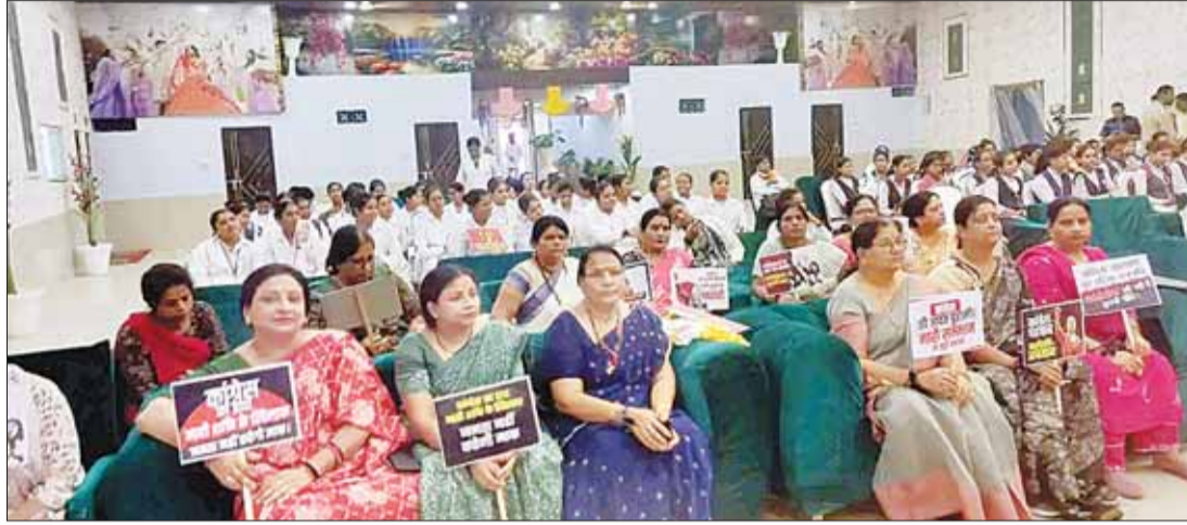
शहडोल (स्वतंत्र मत)

कन्या महाविद्यालय शहडोल एवं शिवानी पैरामेडिकल कॉलेज की छात्राओं को किसकी अनुमति से बुलाया गया? उठे गंभीर सवाल