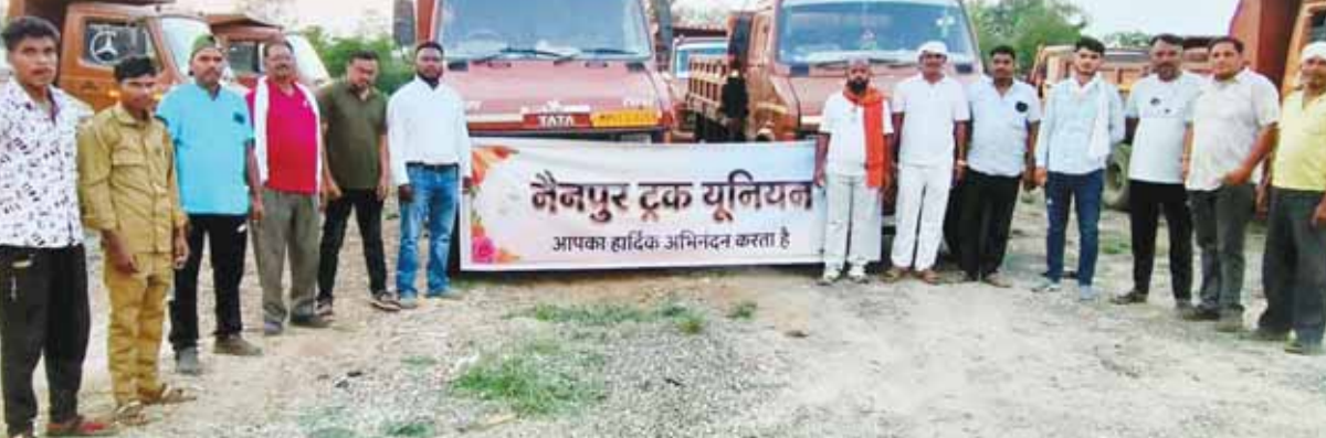
परिवहन किया जा रहा है। यह काम छोटे वाहनों के जरिए खुलेआम हो रहा है, जिससे शासन को लाखों-करोड़ों रुपये के राजस्व का नुकसान उठाना पड़ रहा है। आरोप लगाया कि नियमों का पालन करने वाले ट्रक संचालकों

नैनपुर में ट्रक यूनियन ने खनिजों के अवैध परिवहन के खिलाफ मोर्चा खोल दिया है। यूनियन द्वारा तीन दिवसीय हड़ताल शुरू कर दी गई है। जिससे परिवहन व्यवस्था पर भी असर देखने को मिल रहा है। ट्रक यूनियन का कहना है कि क्षेत्र में रेत, मुरम, गिट्टी और ईंट जैसे भवन निर्माण सामग्री का बड़े पैमाने पर बिना रॉयल्टी के अवैध