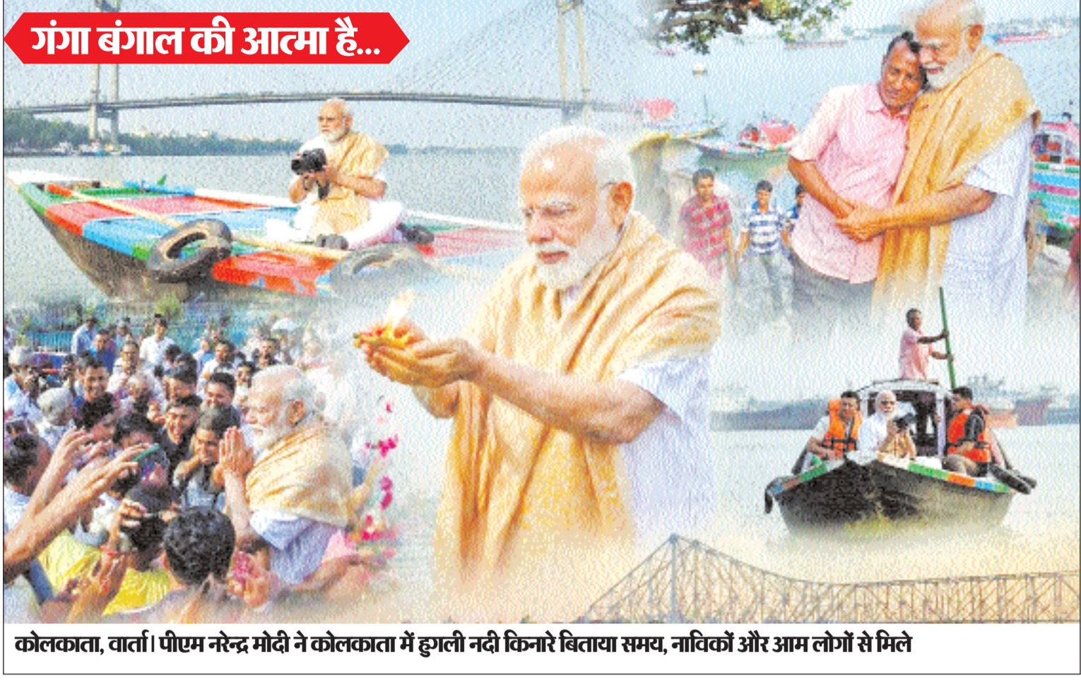
कोलकाता, वार्ता। पीएम नरेन्द्र मोदी ने कोलकाता में हुगली नदी किनारे बिताया समय, नाविकों और आम लोगों से मिले

ईरान की सरकारी समाचार एजेंसी ने बताया कि पश्चिमी तेहरान में एयर डिफेंस से फायरिंग की आवाजें सुनी गईं। इसके बाद इलाके में सुरक्षा व्यवस्था को सक्रिय कर दिया गया। इसी तरह मेहर समाचार एजेंसी ने भी रिपोर्ट दी कि राजधानी के कई हिस्सों में एयर डिफेंस सिस्टम को सक्रिय किया गया ताकि संभावित हवाई खतरों का मुकाबला किया जा सके। हालांकि किसी विशेष लक्ष्य या हमले की विस्तृत जानकारी नहीं दी गई है।