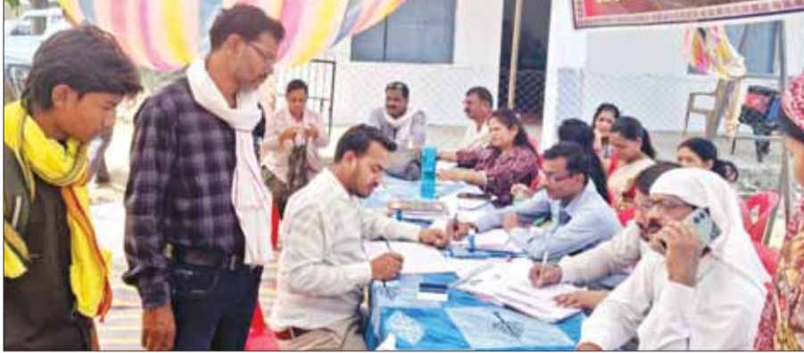
प्रमाण पत्र 25, उपकरण के लिये चिन्हित 15, 8 दिव्यांगों को रेफर किया गया।

भारत सरकार की एडिप एवं वयोश्री योजना के अन्तर्गत दिव्यांगजनों एवं वरिष्ठजनों हेतु सहायक उपकरण एवं कृत्रिम अंग परीक्षण शिविर का आयोजन 24 अप्रैल को जनपद पंचायत नैनपुर में किया गया। शिविर में जबलपुर एलीमको टीम द्वारा सहायक उपकरण चिन्हकन तथा मेडिकल बोर्ड द्वारा दिव्यांगता प्रमाण पत्र दिये गये। शिविर में कुल पंजीयन 52 हुए। दिव्यांगता