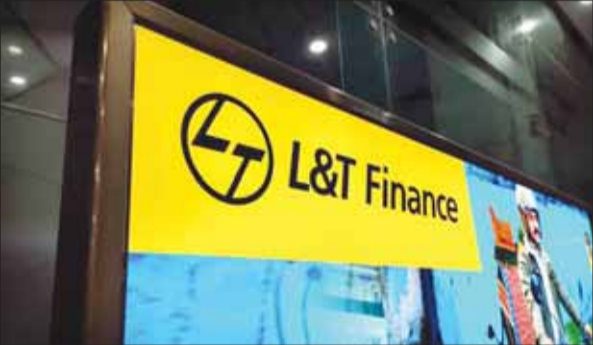
पहुंच गया। चौथी तिमाही में खुदरा वितरण वार्षिक आधार पर 62 प्रतिशत बढ़कर 24,107 करोड़

मुंबई, (वार्ता)। देश की प्रमुख गैर-बैंकिंग वित्तीय कंपनी एलएंडटी फाइनेंस ने वित्त वर्ष 2025-26 में समेकित आधार पर रिकॉर्ड 3,003 करोड़ रुपये का शुद्ध मुनाफा कमाया जो सालाना आधार पर 14 प्रतिशत अधिक है। कंपनी ने वित्तीय परिणामों में बताया है कि वित्त वर्ष की चौथी तिमाही उसका शुद्ध मुनाफा 27 प्रतिशत बढ़कर 807 करोड़ रुपये पर पहुंच गया। गत 31 मार्च को समाप्त वित्त वर्ष में कंपनी द्वारा दिया गया खुदरा ऋण 26 फीसदी बढ़कर 1,19,508 करोड़ रुपये पर