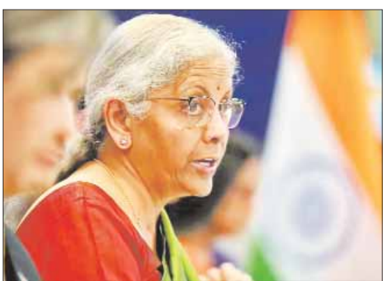
तक पहुंच गयी है। वित्त मंत्री ने कहा कि इन बाजारों का आकार यात्रा की चुनौतियों से तय हुआ है और इस दौरान उत्पन्न दबावों और अस्थिरता के दौर ने नियमन और बाजार अवसररचना को मजबूत किया है। उन्होंने कहा, भारतीय बाजारों का इतिहास हमें पहले के

मुंबई ( वार्ता)। वित्त मंत्री निर्मला सीतारमण ने भारत के प्रतिभूति बाज़ार की विकास यात्रा में बड़ी उपलब्धियों को को रेखांकित करते हुए कहा कि यह यात्रा उल्लेखनीय रही है और भारतीय बाजार आज एक मजबूत, प्रौद्योगिकी-आधारित और वैश्विक स्तर पर प्रतिस्पर्धी परिस्थितिकी तंत्र में सबसे अच्छे बाजारों में एक है। वित्त मंत्री ने विश्वास और ईमानदारी को बाजार की अदृश्य लेकिन सबसे अहम अवसररचना बताते हुए बाजार विनियामक सेबी से कदाचार के विरुद्ध बहुत कठोर रुख अपनाने को कहा। श्रीमती सीतारमण ने भारतीय प्रतिभूति एवं विनियम बोर्ड (सेबी) के 38वें स्थापना दिवस समारोह को संबोधित करते कहा कि भारतीय बाजारों की यात्रा पारंपरिक ट्रेडिंग रिंग से निकल कर आधुनिक इलेक्ट्रॉनिक ऑर्डर बुक तक, भौतिक शेयर प्रमाणपत्रों से पूर्ण डिजिटल इन्वेस्टमेंट तक, और बिखरी हुई निगरानी से रीयल-टाइम नियामकीय पर्यवेक्षण