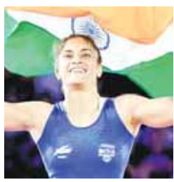
विनेश फोगाट कुश्ती में वापसी पर 57किग्रा वर्ग में उतरेंगी