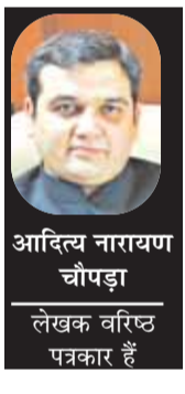
लेखक वरिष्ठ पत्रकार हैं

पश्चिम एशिया में संकट से पैदा हुई अनिश्चितताओं ने ग्लोबल क्रमोडिटी प्राइस, खासतौर पर पेट्रोलियम प्रोडक्ट की कीमतों को हाई पर बनाए रखा है, जिससे तमाम वैश्विक अर्थव्यवस्थाओं पर प्रतिकूल प्रभाव पड़ा है। केंद्रीय बैंक ने भी कहा है कि वैश्विक स्तर पर तेल की ऊंची कीमतों से घरेलू ऊर्जा की कीमतों में तेज बढ़ोतरी करनी पड़ी है। इसके साथ ही अनुमान जाहिर किया गया है कि आगे महंगाई दर 5 फीसदी के लक्ष्य से ऊपर रहने की संभावना है, या ये इसके आसपास स्थिर हो जाएगा। गौरतलब है कि किसी भी देश के सेंट्रल बैंक महंगाई बढ़ने पर इसे काबू करने के लिए अक्सर पॉलिसी रेट बढ़ाने का फैसला करता है। इससे बैंकों के लिए कर्ज लेना महंगा होता है, जिसके बाद बैंक होम लोन, कार लोन और बिजनेस लोन को ब्याज दरें बढ़ा देते हैं। इसके बाद कर्ज लेना महंगा होता है और लोगों के खर्च करने की रफ्तार धीमी पड़ जाती है।