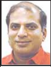
लेखक वरिष्ठ पत्रकार एवं संतर्भकार हैं

अमेरिका को अब इस बात का भलीभांति एहसास हो चुका है कि चीन जैसी उभरती महाशक्ति को रोकना उसके अकेले बूते की बात नहीं रह गई है। यही कारण है कि चीन से लगे हुए खाली हाथ लौटे अमेरिकी राष्ट्रपति डोनाल्ड ट्रंप को अब उम्मीद की सबसे मजबूत किरण प्रधानमंत्री नरेंद्र मोदी के दरबार में दिखाई दे रही है। अमेरिकी विदेश मंत्री मार्को रूबियो का भारत दौरा दरअसल इसी बदली हुई वैश्विक मजबूरी और रणनीति का संकेत है। ट्रंप ने जिस तरह भारत में अमेरिकी राजदूत सर्जियो गोर से बातचीत के दौरान सार्वजनिक तौर पर कहा कि मुझे प्रधानमंत्री मोदी बहुत पसंद हैं। मोदी महान हैं और वो मेरे दोस्त हैं। ट्रंप ने यह तक कहा कि हम भारत के इतने करीब पहले कभी नहीं थे और भारत मुझ पर तथा अमेरिका पर सी फ्रीसदी भरोसा कर सकता है। यह बयान सिर्फ दोस्ती का प्रदर्शन नहीं, बल्कि उस बदलते हुए अमेरिकी रुख का संकेत है जिसमें वॉशिंगटन अब भारत को एशिया में शक्ति संतुलन बनाए रखने वाले सबसे अहम स्तंभ के रूप में देख रहा है। दिलचस्प बात यह भी रही कि मार्को रूबियो ने अपने भारत दौरे में ताजमहल के दौरा का कार्यक्रम भी रखा। कूटनीतिक गलियारों में इसे