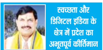
स्वच्छता और डिजिटल इंडिया के क्षेत्र में प्रदेश का अनूतपूर्व कीर्तिमान

भोपाल (स्वतंत्र मत)। प्रधानमंत्री नरेन्द्र मोदी के स्वच्छ भारत के संकल्प को धरातल पर अक्षरशः चरितार्थ करने तथा मुख्यमंत्री डॉ. मोहन यादव के नेतृत्व में मध्यप्रदेश ने स्वच्छता के क्षेत्र में पुनः एक स्वर्णिम अध्याय लिखा है। स्वच्छ सर्वेक्षण 2025-26 के अंतर्गत संचालित देशव्यापी सिटीजन फीडबैक अभियान में, वर्ष 2011 की जगणना के मानदंडों के आधार पर, मध्यप्रदेश समस्त राज्यों और केन्द्र शासित प्रदेशों में देश में प्रथम स्थान पर रहा है। प्रदेश के 35.69 लाख से अधिक जागरूक नागरिकों ने ऑनलाइन माध्यमों से अपनी सहभागिता दर्ज करारकर न केवल स्वच्छता के प्रति अपनी प्रतिबद्धता दर्शाई है, अपितु यह भी सिद्ध कर दिया है कि डिजिटल इंडिया के युग में मध्यप्रदेश के नागरिक