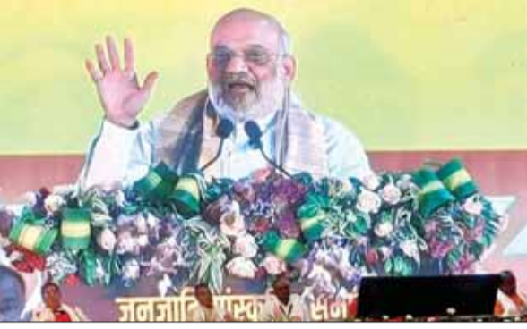
मण्डला (स्वतंत्र मत)।

भगवान बिरसा मुंडा की 150वीं जयंती वर्ष के अवसर पर दिल्ली के ऐतिहासिक लाल किला मैदान में आयोजित जनजाति समारोह में जनजातीय संस्कृति परंपरा आस्था और अस्मिता का विराट राष्ट्रीय प्रतीक दिखाई दिया। देशभर के 500 से अधिक जनजातीय समुदायों से आए लाखों जनजातीय बंधु-भगिनी पारंपरिक वेशभूषा लोकगीत लोकनृत्य वाद्ययंत्रों और सांस्कृतिक प्रतीकों के साथ इस समारोह में सम्मिलित हुए। राजधानी दिल्ली की सड़कों पर जनजातीय संस्कृति का अद्भुत दृश्य उस समय देखने को मिला जब राजदूत चौक रामलीला मैदान अजमेरी गेट चौक कुदसिया बाग और श्यामगिरि मंदिर सहित विभिन्न स्थानों से विशाल शोभायात्रा प्रारंभ होकर लाल किला मैदान पहुंची। लेह-लदाख से लेकर कन्याकुमारी तक के जनजातीय समाज ने अपनी वेशभूषा लोकगीत लोकनृत्य वाद्ययंत्रों और सांस्कृतिक अभिव्यक्तियों के माध्यम से भारत की जनजातीय विरासत की जीवंत झलक प्रस्तुत की। कार्यक्रम में केंद्रीय गृह एवं सहकारिता मंत्री अमित शाह मुख्य