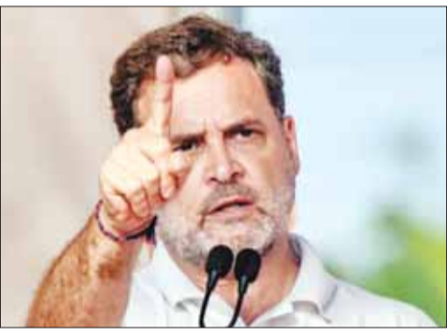
की पूरी परीक्षा प्रणाली और छात्र सुरक्षा पर एक बार फिर

देश की सबसे बड़ी यूनिवर्सिटी प्रवेश परीक्षा को लेकर इस वक की सबसे बड़ी, सनसनीखेज और तीखी राजनीतिक खबर सामने आ रही है। आज आयोजित हुई कामन यूनिवर्सिटी एंट्रेंस टेस्ट-यूजी यानी सीयूईटी-यूजी 2026 परीक्षा के दौरान देश के कई सेंटर्स पर भारी हंगामा और अव्यवस्था देखने को मिली है। जानकारी के मुताबिक, सुबह की शिफ्ट का पेपर अपने तय समय पर शुरू न होने के कारण परीक्षा केंद्रों पर बेहद तनावपूर्ण माहौल बन गया, जिसने अब एक बहुत बड़ा सियासी रूप अख्तियार कर लिया है। हाल के महीनों में नीट, सीबीएसई और एसएससी जैसी बड़ी राष्ट्रीय परीक्षाओं से जुड़े विवादों के बाद आज की इस घटना ने देश