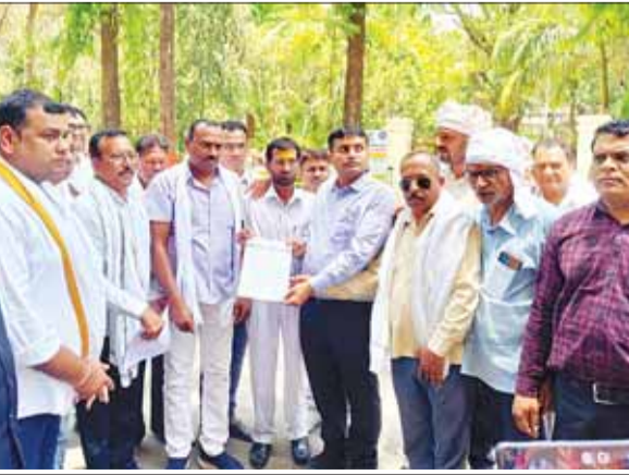
जबलपुर (स्वतंत्र मत)

बड़ा पत्थर में शराब दुकान का विरोध कांग्रेस ने कलेक्टर के नाम सौंपा ज्ञापन