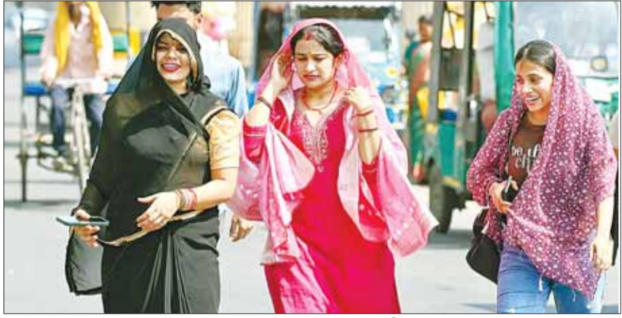
जबलपुर (स्वतंत्र मत)

तापमान में हुई बढ़ोतरी, सड़कों पर पसरा सन्नाटा