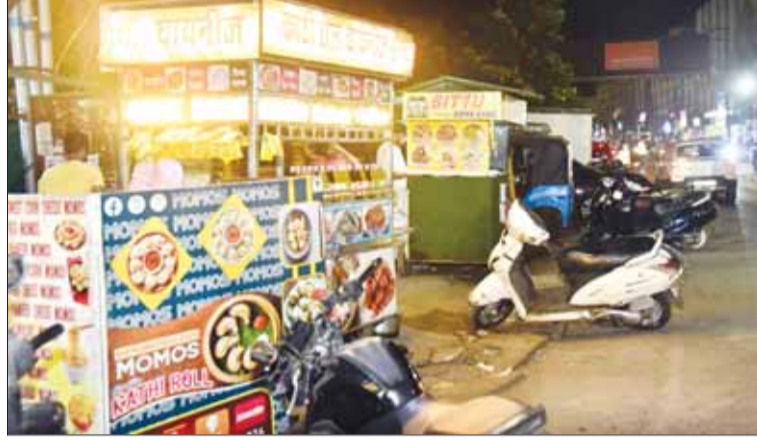
चौपट होती नजर आ रही है।

एक तरफ नगर निगम और जिला प्रशासन इन ठेले-टपरों को हटाने जूझ ही रही है कि दूसरी ओर अतिक्रमणकारियों ने अपनी आवक बढ़ाने के चक्कर में जगह-जगह पर ठेले टपरों जमाकर एक नया ट्रेंड चालू कर दिया है। इससे ना केवल सड़कों पर भारी तादाद में ठेले-टपरों नजर आ रहे हैं। बल्कि इनकी वजह से आए दिन लंबा जाम और हादसे हो रहे हैं। ऐसे में आने वाले समय इन अतिक्रमणों की वजह से शहर की ट्रैफिक व्यवस्था पूरी तरह से