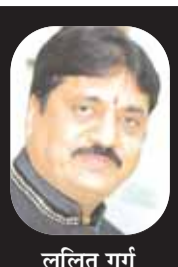
लेखक वरिष्ठ पत्रकार एवं स्तंभकार हैं

पश्चिम बंगाल विधानसभा चुनाव में भारतीय जनता पार्टी (भाजपा) की ऐतिहासिक, अद्भुत, अविस्मरणीय एवं करिश्माई जीत के पीछे राष्ट्रीय स्वयंसेवक संघ (संघ) की बहुत बड़ी भूमिका रही है। निश्चिततौर पर इस शानदार जीत के लिये प्रधानमंत्री नरेन्द्र मोदी एवं गृहमंत्री अमित शाह मुख्य भूमिका में हैं। लेकिन बंगाल में ममता बनर्जी की मजबूत