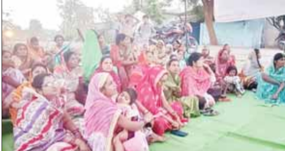
कटंगी (स्वतंत्र मत)

शराब बिक्री में आई तेजी से गिरावट ठेकेदार से महिलाओं से की चर्चा