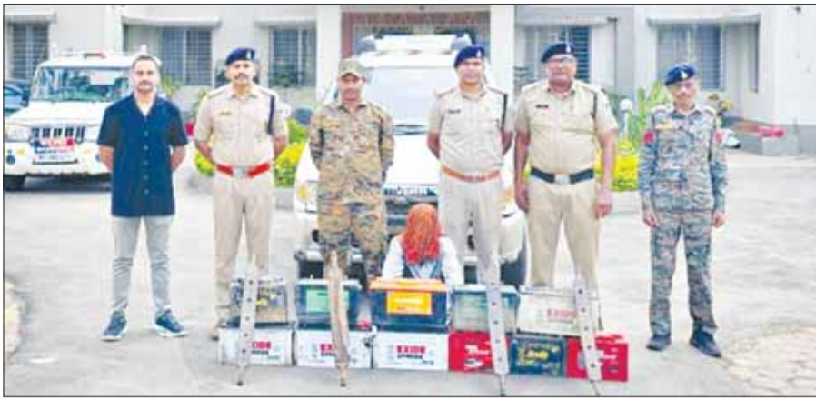
बालाघाट (स्वतंत्र मत)

दिन में वाहनों की रेकी, रात में चोरी की वारदात