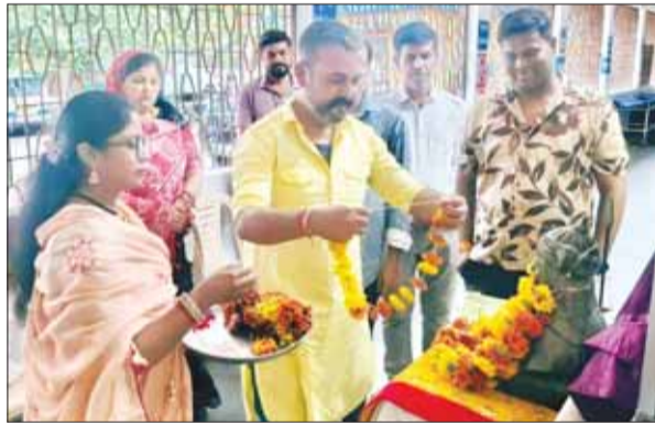
अस्पताल में जयंती मनाते और मरीजों के परिजन को फल प्रदान करते हुए।

कार्यक्रम का शुभारंभ महाराणा प्रताप के चित्र पर माल्यार्पण और दीप प्रज्वलन के साथ हुआ। राजपुत समाज के लोगों ने कहा महाराणा प्रताप ने मुगल साम्राज्य की विशाल सेना के सामने झुकने से इनकार कर स्वतंत्रता के लिए जंगलों और