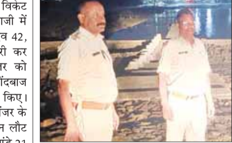
मण्डला (स्वतंत्र मत)।