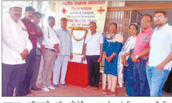
मण्डला (स्वतंत्र मत)

कलेक्टर के निर्देशानुसार विश्व रेडक्रॉस दिवस के अवसर पर 8 मई को आमजन के लिए विभिन्न जनहितकारी कार्यक्रमों का आयोजन किया गया इसी क्रम में आयुष विभाग एवं रेडक्रॉस सोसाइटी के संयुक्त तत्वाधान में प्राथमिक स्वास्थ्य केन्द्र महाराजपुर में निःशुल्क स्वास्थ्य शिविर का आयोजन किया गया। कार्यक्रम का मुख्य उद्देश्य वरिष्ठ नागरिकों के स्वास्थ्य का परीक्षण कर होने वाली शारीरिक मानसिक एवं सामाजिक समस्याओं के निराकरण जागरूकता एवं उपचार सेवाएं प्रदान करना रहा कार्यक्रम का शुभारंभ विश्व रेडक्रॉस आंदोलन के संस्थापक हेनरी ड्यूनेट 1828-1910 के चित्र पर माल्यापण एवं पूजन के साथ किया गया। शिविर में उपस्थित सभी वरिष्ठजनों का सम्मान मुख्य चिकित्सा एवं