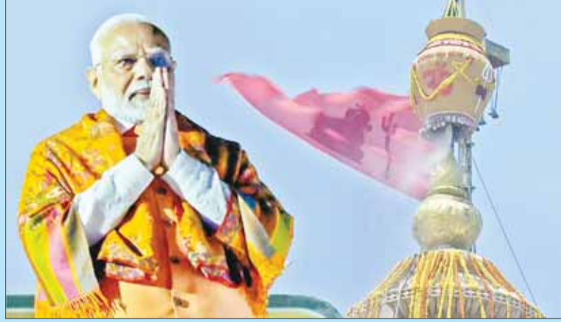
बाद भी, हमें सोमनाथ के शाश्वत और अविनाशी होने पर गर्व है। प्रधानमंत्री मोदी ने वर्तमान मंदिर

भारत को झुका नहीं सकती। उन्होंने कहा, आज प्रभास पाटन की पवित्र भूमि एक दिव्य आभा से परिपूर्ण है। महादेव का यह प्राकट्य, आसमान से हो रही पुष्पवर्षा, कला, संगीत और नृत्य की भव्य प्रस्तुतियां, वैदिक मंत्रों का उच्चारण और गर्भगृह में चल रहा शिव पंचाक्षरी का अखंड पाठ एक अद्भुत दृश्य प्रस्तुत कर रहे हैं। सोमनाथ मंदिर के साथ अपने व्यक्तिगत जुड़ाव को साझा करते हुए, प्रधानमंत्री ने कहा, दादा सोमनाथ के एक समर्पित भक्त के रूप में, मैं यहां कई बार आया हूँ और अनगिनत बार उनके चरणों में शीशा झुकाया है। लेकिन आज जब मैं यहां आ रहा था, तो समय की यह यात्रा मुझे एक बेहद सुखद और भावुक अनुभूति दे रही थी। मंदिर के ऐतिहासिक संघर्ष और पुनर्निर्माण को याद करते हुए उन्होंने आगे कहा कि इसके पहले विनाश के इतने वर्षों