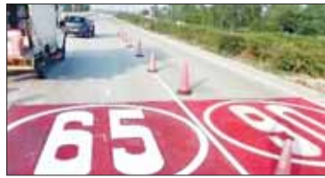
65 किलोमीटर प्रति घंटा की स्पीड लिमिट बढ़े और स्पष्ट अक्षरों में पेंट की जा रही है।

नई दिल्ली। अक्सर देखा जाता है कि कई चालक साइड में लगे स्पीड साइनबोर्ड पर ध्यान नहीं दे पाते, जिससे अनजाने में ओवरस्पीडिंग हो जाती है। ओवरस्पीडिंग सड़क हादसों का एक बड़ा कारण मानी जाती है। राष्ट्रीय राजमार्ग प्राधिकरण ने राष्ट्रीय राजमार्ग 334बी पर एक नई पहल शुरू की है। अब इस हाईवे पर वाहन चालकों को स्पीड लिमिट जानने के लिए साइड में लगे बोर्ड देखने की जरूरत नहीं पड़ेगी, क्योंकि स्पीड लिमिट सीधे सड़क पर ही लिखी जा रही है। हाईवे की दायीं लेन पर 90 किलोमीटर प्रति घंटा और बायीं लेन पर