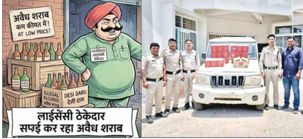
लाइसेंसी ठेकेदार सफई कर रहा अवैध शराब