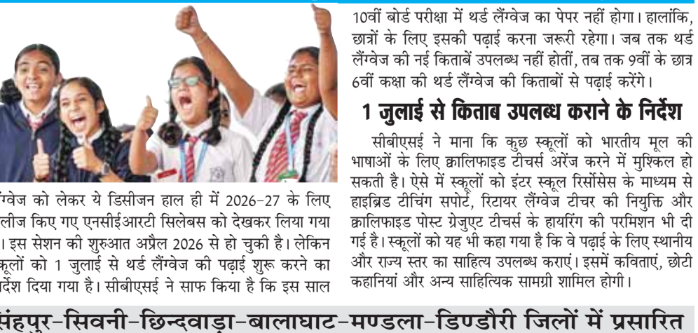
लैंग्वेज को लेकर वे डिजिटल रूप में 2026-27 के लिए रिलीज किए गए एनसीईआरटी सिलेबस को देखकर लिया गया है।

नई दिल्ली सीबीएसई ने अपने सभी स्कूलों में कक्षा 9वीं और 10वीं में श्री लैंग्वेज पॉलिसी अनिवार्य कर दी है। इसके तहत 9वीं और 10वीं के बच्चों को तीन भाषाओं की पढ़ाई करनी होगी। इनमें से 2 भारतीय भाषाएं होनी चाहिए। सीबीएसई का नोटिफिकेशन 1 जुलाई से लागू होगा। इस फैसले से 9वीं और 10वीं के मिलाकर लगभग 50 लाख बच्चे प्रभावित होंगे। साथ ही इस साल 10 वीं के बच्चों को तीसरी भाषा का पेपर नहीं देना होगा। श्री लैंग्वेज पॉलिसी के तहत, एक भारतीय और एक विदेशी भाषा के साथ एक क्षेत्रीय भाषा पढ़ाई जानी है। सीबीएसई ने स्पष्ट किया है कि स्कूल, छात्रों को पसंद के अनुसार थर्ड लैंग्वेज चुन सकते हैं। सभी स्कूलों को अपनी चुनी हुई लैंग्वेज की जानकारी 30 जून तक बोर्ड को देनी होगी। बोर्ड ने कहा कि लैंग्वेज को लेकर वे डिजिटल रूप में 2026-27 के लिए रिलीज किए गए एनसीईआरटी सिलेबस को देखकर लिया गया है। इस सेशन की शुरुआत अप्रैल 2026 से हो चुकी है। लेकिन स्कूलों को 1 जुलाई से थर्ड लैंग्वेज की पढ़ाई शुरू करने का निर्देश दिया गया है। सीबीएसई ने साफ किया है कि इस साल