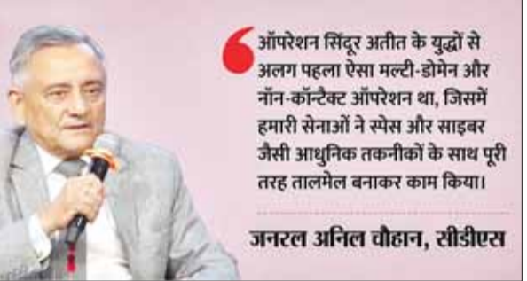
जनरल अनिल चौहान, सीडीएस

नई दिल्ली। चीफ ऑफ डिफेंस स्टाफ जनरल अनिल चौहान ने भारतीय सेना के बदलते स्वरूप को लेकर एक बड़ा बयान दिया है। उन्होंने अपने पुराने अनुभवों को याद करते हुए सेना के मानवीय चेहरे और आधुनिक युद्ध कौशल दोनों पर खुलकर चर्चा की। जनरल अनिल चौहान ने ऑपरेशन सिंदूर को लेकर बेहद महत्वपूर्ण बातें कही। उन्होंने कहा कि ऑपरेशन सिंदूर अतीत में लड़े गए सभी युद्धों से बिल्कुल अलग है। यह ऑपरेशन आज भी जारी है। इतिहास में पहली बार यह एक वास्तविक मल्टी-डोमेन ऑपरेशन था। इसका मतलब है कि सेना के तीनों अंगों ने एक साथ बेहद सटीक तालमेल के साथ काम किया। यह बड़े पैमाने पर 'नॉन-कॉन्टैक्ट वॉरफेयर' यानी बिना आमने-सामने आए लड़ा जाने वाला युद्ध था। इस ऑपरेशन में अंतरिक्ष और साइबर जैसी आधुनिक तकनीकों का भरपूर इस्तेमाल किया गया। जनरल चौहान ने बताया कि भले ही यह मुख्य सैन्य कार्रवाई केवल 88 घंटे चली, लेकिन इसके लिए बहुत बड़े स्तर पर समन्वय की जरूरत थी। इसमें थल सेना, वायु सेना और नौसेना के साथ-साथ सरकार के अन्य विभागों और विभिन्न एजेंसियों ने मिलकर काम किया। यह एक बेहद सुनियोजित ऑपरेशन था। सीडीएस ने कहा कि इस ऑपरेशन में जीत के पैमाने भी पूरी तरह अलग थे। उन्होंने तकनीक को ताकत को समझते हुए कहा कि आप कल्पना कीजिए कि 300 या 400 किलोमीटर दूर से कोई चीज बिल्कुल सटीकता के साथ सीधे इस कमरे में आकर गिरे। हमारे भूगोल में ऐसा पहले कभी नहीं देखा गया था। यही वजह है कि वह विशेष ऑपरेशन पहले की तुलना में पूरी तरह से अलग और ऐतिहासिक था।