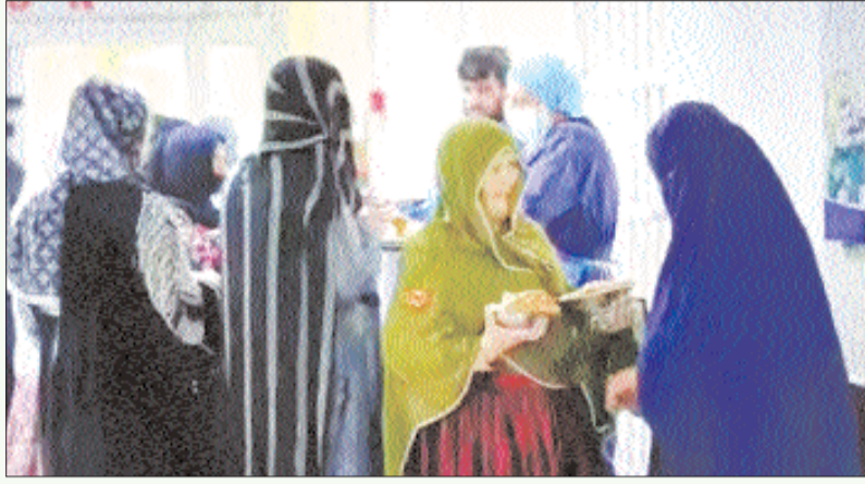
रिश्तेदार के हवाले करना पड़ा, क्योंकि उसके अपॉइंटड और लीवर में सिस्ट का इलाज करना