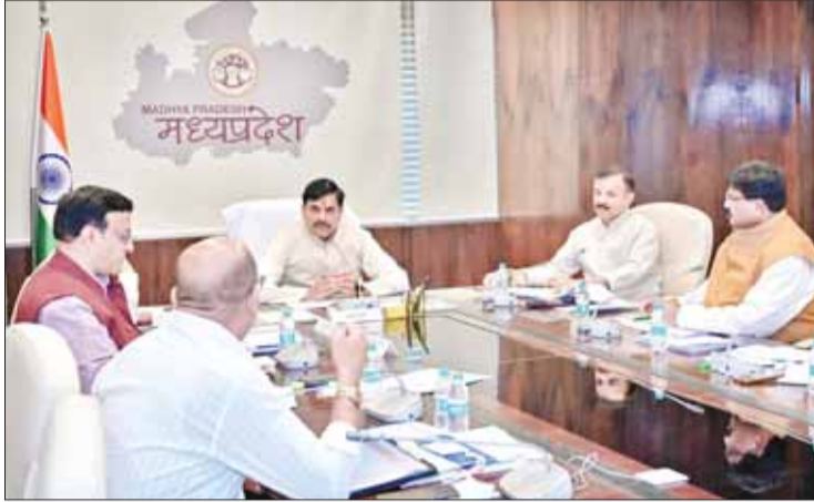
निकटतम हो) में पहुंच जाए।

मुख्यमंत्री डॉ. मोहन यादव ने कहा है कि प्रदेश में नागरिकों को संस्थागत लोक परिवहन की सुविधा उपलब्ध कराने के लिये मुख्यमंत्री सुगम परिवहन सेवा योजना शीघ्र प्रारंभ की जाये। मुख्यमंत्री डॉ. यादव मंत्रालय में परिवहन विभाग की समीक्षा बैठक ले रहे थे। बताया गया कि प्रदेश में सड़क सुरक्षा सचिवालय का गठन किया जा रहा है। बैठक में परिवहन एवं स्कूल शिक्षा मंत्री उदय प्रताप सिंह भी उपस्थित थे। मुख्यमंत्री डॉ. यादव ने कहा है कि आमजन के लिए सुरक्षित, सुगम और सुलभ परिवहन सुविधा उपलब्ध कराना हमारा दायित्व है। बेहतर लोक परिवहन आसान यात्रा का साधन ही नहीं, प्रदेश के सामाजिक और आर्थिक विकास की जीवन रेखा भी है। प्रदेश की सीमा में अन्य राज्यों से आने वाले मालवाहक वाहनों की जांच के लिए परिवहन चौकियों और टोल नाकों को और अधिक आधुनिक एवं सुविधा सम्पन्न बनाया जाए। इसके लिए परिवहन चौकियों को शीघ्र ही एकीकृत (इंटीग्रेटेड) करने के प्रयास किए जाएं। मुख्यमंत्री ने कहा कि राह-वीर योजना का व्यापक प्रचार-प्रसार किया जाए। मुख्यमंत्री ने कहा कि परिवहन विभाग में मानव संसाधन की कमी को पूर्ण अभियान चलाकर की जाए। मुख्यमंत्री डॉ. यादव ने कहा कि प्रदेश में सर्वाधिक दुर्घटना क्षेत्रों की पहचान करा ली जाए, जिससे जरूरतमंदों को जल्द से जल्द मेडिकल सर्विसेस मुहैया कराई जा सकें। विभिन्न विभागों द्वारा दी जा रही एम्बुलेंस सेवाओं को एक प्लेटफार्म पर लाया जाए, जिससे दुर्घटना क्षेत्रों में जरूरतमंद तक 30 मिनट से भी कम समय में एम्बुलेंस ऑटो मोड (जो स्पॉट से