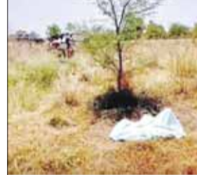
गाई और देखते ही देखते मौके पर ग्रामीणों की भारी भीड़ जमा हो गई। स्थानीय लोगों की सूचना पर पहुंची पनागर पुलिस ने मार्ग कायम कर शव को पोस्टमार्टम के लिए

जबलपुर (स्वतंत्र मत)। पनागर स्थित टॉप-10 ढाबा के पास सुबह उस वक सनसनी फैल गई, जब राहगीरों ने एक अज्ञात वृद्ध का शव सड़िध परिस्थितियों में पड़ा देखा। शव मिलने की खबर पूरे इलाके में आग की तरह फैल