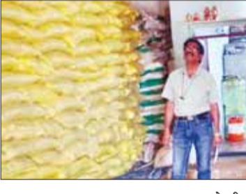
जबलपुर (स्वतंत्र मत)