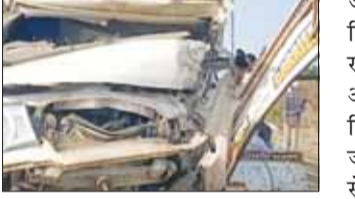
जबलपुर (स्वतंत्र मत)

जबलपुर से सिवनी के लिए रवाना हुई पिकअप गाड़ी लखनादौन में विगत दिन ट्रैक्टर से टकराकर पलट गई। हादसे में पिकअप सवार एक युवक की मौके पर मौत हो गई, वहीं 2 युवकों के शरीर पर गंभीर चोटें आई हैं। इसके अलावा पिकअप में लोड 12 बकरियां भी मारी गई हैं। पुलिस के मुताबिक बकरियों से भरा पिकअप वाहन