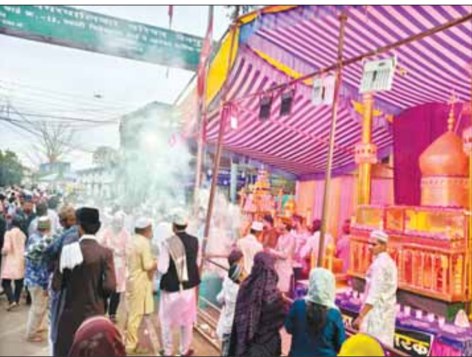
नैनपुर( स्वतंत्र मत)

नैनपुर (स्वतंत्र मत)। नैनपुर की सीमा से लगे सिवनी जिले के आपस में खैरौंजी में दो गाड़ियों की आमने सामने से टक्कर हो गई। घुमावदार सड़क मार्ग में अपना संतुलन खोकर दो वाहन आमने सामने से टकरा गये। शुक्र वी बात यह रही कि इस दुर्घटना में कोई जनहानि नहीं हुई। दोनों वाहन सवारों को मामूली चोट आई है। बताया गया कि एक वाहन वेगन आर गाड़ी खवासा की थी जबकि विपरीत दिशा से आने वाला माल वाहक सिवनी पलारी का बताया गया है। इस दुर्घटना के बाद मालवाहक का डीजल सड़क पर बिखर गया जिससे लोगो को आने जाने में परेशानी का सामना करना पड़ा।