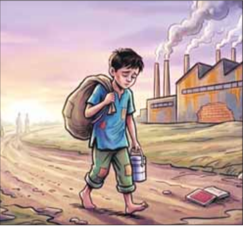
मण्डला/नारायणगंज (स्वतंत्र मत)

जनपद पंचायत नारायणगंज अंतर्गत ग्राम पंचायत खमरिया के भरिया टोला स्थित जल निगम प्लांट से मजदूरी कर घर लौट रहे 17 वर्षीय किशोर की सड़क दुर्घटना में मौत हो गई जबकि उसके पिता गंभीर रूप से घायल हो गए। घटना के बाद क्षेत्र में शोक व्याप्त है। वहीं जल निगम प्लांट में नाबालिगों से मजदूरी कराए जाने के आरोपों को लेकर ग्रामीणों में नाराजगी देखी जा रही है। जानकारी के अनुसार 25 जून को शाम करीब 6 बजे जून लावर चारगांव निवासी