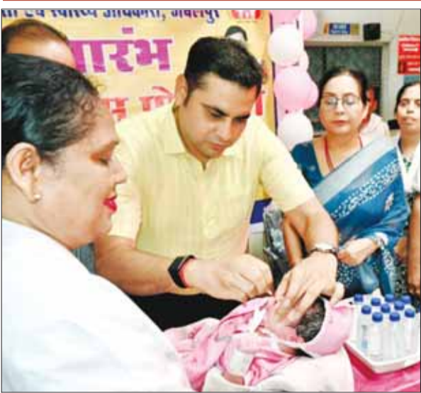
जबलपुर (स्वतंत्र मत)।

कलमवीर संघर्ष संगठन के पदाधिकारियों ने बच्चों को पिलाई दो बूँद जिंदगी की