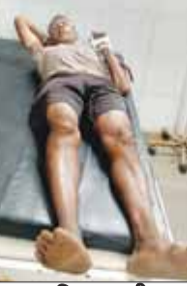
वन विभाग की कार्रवाई में दो आरोपी पकड़े गए, एक घायल