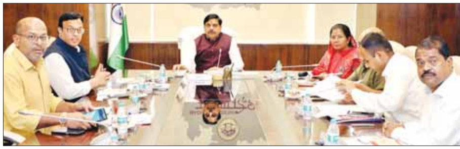
उज्जैन राजस्व संभाग सहित प्रदेश के 11 जिलों में जल जीवन मिशन का शत प्रतिशत कार्य हो चुका है।

भोपाल। मुख्यमंत्री डॉ. मोहन यादव ने कहा है कि नागरिकों को समुचित पेयजल आपूर्ति हमारी सर्वोच्च प्राथमिकता है। उन्होंने अधिकारियों को निर्देश दिए हैं कि नागरिकों को पर्याप्त और निर्बाध पेयजल उपलब्ध कराने में किसी भी प्रकार की कमी न रहे। गर्मी के मौसम और बढ़ती आवश्यकताओं को देखते हुए जलापूर्ति व्यवस्था को सतत निगरानी की जाए। मुख्यमंत्री डॉ. यादव ने निर्देश दिये कि जहां जैसी आवश्यकता हो, वहां वैसी त्वरित व्यवस्थाएं की जाएं।