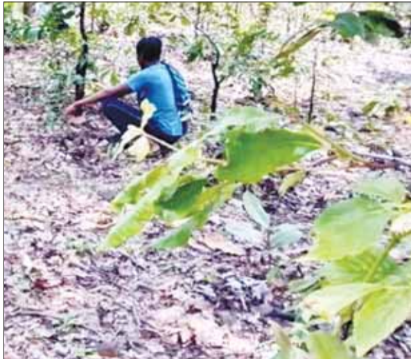
अपराधों से संबंधित सूचनाएं तत्काल वन विभाग तक पहुंचा सकते हैं। रिपोर्टिंग प्रक्रिया को आसान और प्रभावी बनाने के लिए ऐप में एक सुव्यवस्थित डॉन-डाउन सूची उपलब्ध कराई गई है, जिसमें अवैध वृक्ष कटाई, वन्यजीव शिकार, अतिक्रमण, आगजनी और अन्य वन अपराधों की श्रेणियां शामिल हैं।

भोपाल (स्वतंत्र मत)। वन और वन्य प्राणियों की सुरक्षा एवं संरक्षण को अधिक प्रभावी बनाने के उद्देश्य से वन विभाग ने 'गुप्तचर ऐप' विकसित किया है। 'गुप्तचर ऐप' से स्थानीय नागरिक स्वयं को 'गुप्तचर' के रूप में पंजीकृत कर वन संरक्षण अभियान का हिस्सा बन सकते हैं। ऐप की पंजीकरण प्रक्रिया सरल, सहज और यूजर फ्रेंडली बनाई गई है। इससे अधिक से अधिक ग्रामीण ऐप से आसानी से जुड़ सकेंगे। पंजीकरण के साथ ही प्रत्येक उपयोगकर्ता को एक विशिष्ट गुप्तचर आईडी प्रदान की जाती है, जिससे उसकी पहचान पूर्णतः गोपनीय बनी रहती है। 'गुप्तचर ऐप' एक प्रभावी, पारदर्शी और सहभागी तंत्र के रूप में वन संरक्षण के प्रयासों को मजबूत करेगा तथा प्राकृतिक संसाधनों की सुरक्षा में स्थानीय समुदाय की भूमिका को और अधिक सुदृढ़ बनाएगा। यह ऐप विशेष रूप से दक्षिण सिवनी वनमंडल के अंतर्गत वन क्षेत्रों के आसपास निवास करने वाले ग्रामीणों की वन सुरक्षा में सक्रिय भागीदारी सुनिश्चित करने के लिए तैयार किया गया है। ऐप के माध्यम से पंजीकृत गुप्तचर वन