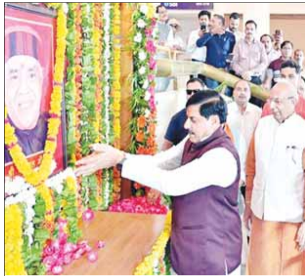
का अनुसरण करते हुए प्रदेश की जनता के कल्याण के लिए निरंतर कार्य कर रही है। मुख्यमंत्री डॉ. यादव ने कहा कि श्रद्धेय बाबूलाल जी ने अपने

भोपाल। मुख्यमंत्री डॉ. मोहन यादव ने प्रदेश के पूर्व मुख्यमंत्री श्रद्धेय बाबूलाल गौर की जयंती पर विधानसभा के सेंट्रल हॉल में उनके चित्र पर पुष्पांजलि अर्पित की और उनके कार्यकाल के स्वर्णिम क्षणों का स्मरण किया। मुख्यमंत्री डॉ. यादव ने मीडिया प्रतिनिधियों से चर्चा करते हुए कहा कि श्रद्धेय बाबूलाल गौर जी मध्यप्रदेश के ऐसे राजनेता रहे, जिन्होंने अपने जनहितैषी कार्यों से लोगों के दिलों में जगह बनाई। वे सदैव हमारे लिए आशीर्वाददाता की भूमिका में रहे। राज्य सरकार उनके बताए मार्ग और आदर्शों