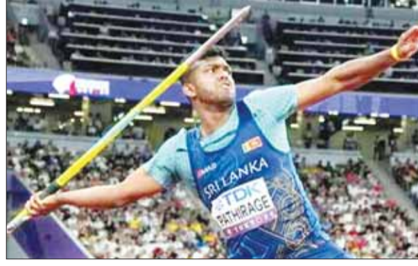
पहला श्रो 84.49 मीटर का किया

92.67 मीटर दूर भाला फेंका; एशिया में दूसरे नंबर पर, पाकिस्तान के अरशद टॉप पर