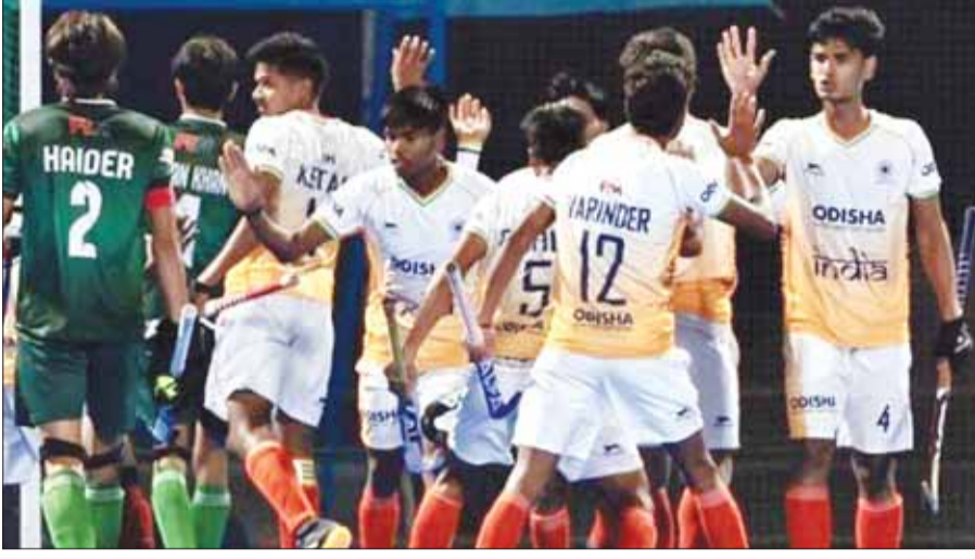
नई दिल्ली। भारतीय अंडर-18 में हॉकी टीम ने शुक्रवार को सेमीफाइनल में पाकिस्तान को 5-3 से हरा दिया। इस जीत के साथ ही भारत ने एशिया कप के फाइनल में जगह बना ली है। फाइनल में भारत का सामना शनिवार को जापान से होगा।

आखिरी 15 मिनट में 3 गोल कर सेमीफाइनल जीता, फाइनल में जापान से मुकाबला