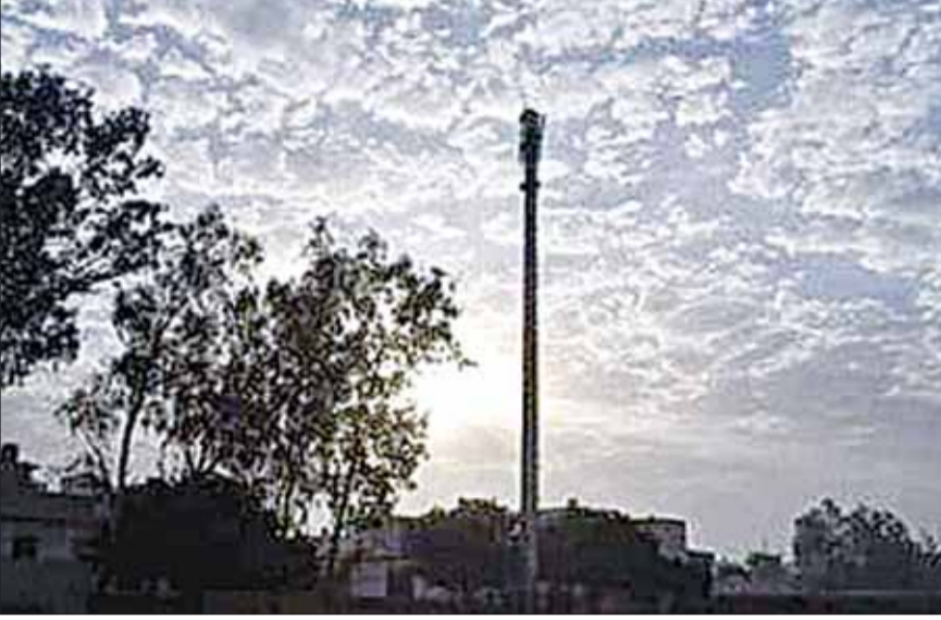
जबलपुर (स्वतंत्र मत)

तापमान में फिर उछाल, तेज गति से चल रही पश्चिमी हवाएं