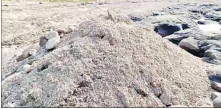
बालाघाट (स्वतंत्र मत)

जिले में प्रधानमंत्री आवास योजना के तहत अपने पक्के घर का सपना देख रहे हजारों गरीब परिवार इन दिनों गंभीर संकट का सामना कर रहे हैं। जिले में रेत की उपलब्धता नहीं होने और कई मामलों में आवास निर्माण के लिए राशि का पूर्ण भुगतान न होने से करीब 20 हजार आवास अधूरे पड़े हैं। मानसून की दस्तक के बीच अधूरे मकानों में रह रहे हितग्राहियों की चिंता लगातार बढ़ती जा रही है।