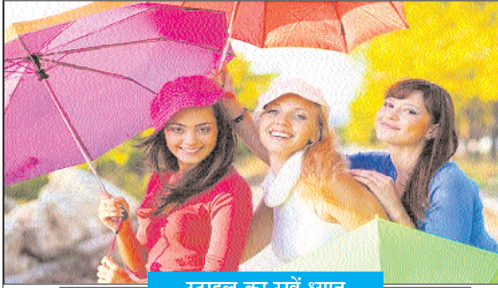
स्टाइल का रखें ध्यान

ब्लाउजेस, शर्ट्स, टाई और अन्य एसेसरीज जैसे नेक पीसेस, स्कार्फ्स, बैग्स और शूज में वैराइटी के कारण वे अपनी वियरिंग स्टाइल को मन मुताबिक या मौसम के मिजाज के तौर पर ढाल सकते हैं। आप इस मौसम में जींस की जगह कैप्रि, ट्राउजर जिगजैंग कुछ और ट्राई कर सकती हैं।