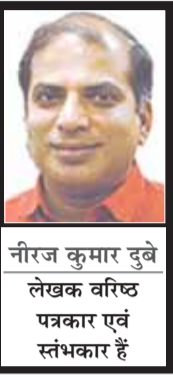
नीरज कुमार दुबे लेखक वरिष्ठ पत्रकार एवं स्तंभकार हैं

लौटेंगी और उन्हें मृत्यु का कोई भय नहीं है, लेकिन बांग्लादेश की वर्तमान राजनीतिक परिस्थितियां यह संकेत दे रही हैं कि वहां उनकी प्रतीक्षा केवल राजनीतिक संघर्ष नहीं बल्कि संभवतः मृत्यु भी कर रही है। वर्ष 2024 में सत्ता से बेदखल होने के बाद से उनके खिलाफ मानवता विरोधी अपराधों के कई मामले दर्ज किए गए हैं और उन्हें मृत्युदंड तक सुनाया जा चुका है। ऐसे माहौल में उनकी वापसी केवल एक राजनीतिक घटना नहीं बल्कि बांग्लादेश की सत्ता, न्याय व्यवस्था और प्रतिशोध की राजनीति की सबसे बड़ी परीक्षा बन सकती है।