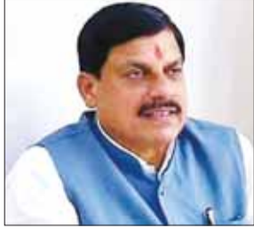
निवेश के अवसर सृजित होंगे।

क्षेत्र में विकसित होने वाला डॉ. श्यामा प्रसाद मुखर्जी स्मार्ट इंस्ट्रियल पार्क भोपाल और आसपास के क्षेत्रों में औद्योगिक गतिविधियों के विस्तार का नया आधार बनेगा। परियोजना में आधुनिक औद्योगिक अधोसंरचना, उल्क्रे सड़क एवं परिवहन संपर्क, आईटी एवं एआई आधारित सुविधाएं, लॉजिस्टिक्स एवं वेयरहाउसिंग कॉम्प्लेक्स तथा भविष्य की औद्योगिक आवश्यकताओं के अनुरूप स्मार्ट इंफ्रास्ट्रक्चर विकसित किया जाएगा, जिससे निवेशकों को विश्वस्तरीय औद्योगिक वातावरण उपलब्ध हो सके। यह परियोजना वर्क-लिव-ग्रेट मॉडल पर आधारित होगी, जहां उद्योगों के साथ कोशल विकास, नवाचार और गुणवत्तापूर्ण जीवन के लिए आवश्यक सुविधाओं का समन्वित विकास किया जाएगा। पार्क में उच्च मूल्य विनिर्माण, गारमेंट, टॉयज, आईटी, एआई, लॉजिस्टिक्स तथा उभरती तकनीकों से जुड़े उद्योगों को स्थापित करने की परिकल्पना की गई है। इससे राजधानी में विविध औद्योगिक क्षेत्रों का संतुलित विकास सुनिश्चित होगा और नए