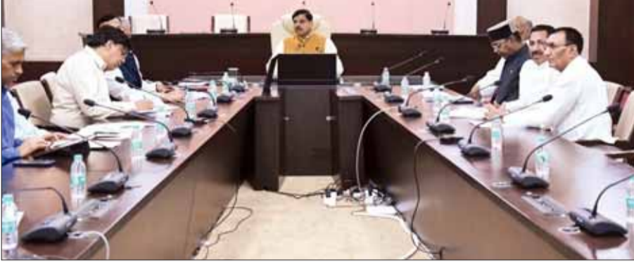
प्रतिकूल प्रभाव न पड़े।

प्रदेश में संभावित अल्प वर्षा को देखते हुए राज्य सरकार ने जिला स्तर पर एक्शन प्लान तैयार किया है। इसके लिए हर जिले में कलेक्टर की अध्यक्षता में जल संकट आकस्मिक योजना बनाई जाएगी। इसके साथ ही सरकार द्वारा रियल-टाइम मॉनिटरिंग एवं पूर्व चेतावनी प्रणाली के लिए राज्य स्तरीय जल डैशबोर्ड बनाए जाएंगे। दूसरी ओर ग्रामीण क्षेत्रों में जल जीवन मिशन की ग्रामवार समीक्षा करके बंद, अपूर्ण नल-जल योजनाओं की मरम्मत का 90 दिवसीय अभियान चलाया जाएगा। यह निर्णय गुरुवार को मंत्रालय में मुख्यमंत्री डॉ. मोहन यादव की मौजूदगी में हुई बैठक में लिया गया। बैठक में मुख्यमंत्री डॉ. यादव ने कहा है कि संभावित अल्प वर्षा की स्थिति को चुनौती नहीं, बल्कि बेहतर योजना, वैज्ञानिक खेती और समयबद्ध तैयारी के अवसर के रूप में लिया जाए। सभी संबंधित विभाग आपसी समन्वय के साथ कार्य करते हुए किसानों को समय पर आवश्यक मार्गदर्शन उपलब्ध कराएं, ताकि प्रदेश में कृषि उत्पादन और किसानों की आय पर