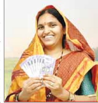
पीएम की आर्थिक सलाहकार परिषद का राश्यों को सुझाव

प्रधानमंत्री की आर्थिक सलाहकार परिषद (ईएसी-पीएम) ने सोमवार को कहा कि राज्यों में महिलाओं से जुड़ी नकद सहायता योजनाओं की राशि की समय-समय पर समीक्षा होनी चाहिए। परिषद ने कहा कि नकद राशि महंगाई बढ़ने और परिवारों के खर्च में बदलाव को देखते हुए जरूरत पड़ने पर बढ़ाई जानी चाहिए। ईएसी-पीएम ने अपनी रिपोर्ट में महाराष्ट्र को माझी लाइकी बहिन योजना और ओडिशा की सुभद्रा योजना का अध्ययन किया। रिपोर्ट में कहा गया कि इन योजनाओं से महिलाओं की बचत बढ़ी, घरेलू खर्च में मदद मिली और परिवार की आर्थिक स्थिति बेहतर हुई। रिपोर्ट में सुझाव दिया गया कि नकद सहायता के साथ महिलाओं को डिजिटल साक्षरता, कौशल विकास और स्वयं सहायता समूह से भी जोड़ा जाए, ताकि वे आर्थिक रूप से और मजबूत बन सकें। नकद सहायता मिलने के बाद यूपीआई से भुगतान भी बढ़ा। महिलाएं शिक्षा, स्वास्थ्य और जीवनशैली से जुड़ी चीजों पर पहले से ज्यादा खर्च करने लगी हैं। ईएसी-पीएम के अनुसार, 15 से ज्यादा राज्यों में महिलाओं को सीधे बैंक खाते में नकद सहायता दी जा रही है। इन योजनाओं का लाभ करीब 12 करोड़ महिलाओं को मिल रहा है। परिषद का कहना है कि महिलाओं को सीधे आर्थिक सहायता देने से परिवार की स्थिति बेहतर होती है और महिलाओं की आर्थिक भागीदारी बढ़ती है। इसलिए महंगाई के अनुसार सहायता राशि की समय-समय पर समीक्षा की जानी चाहिए।