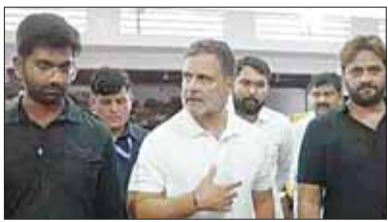
राजस्थान के स्थानीय बस और ट्रक बाँड़ी-बिल्डर्स से मुलाकात के दौरान ऐसा भारत देखने को मिला, जो अपने दम पर रोजगार पैदा करता है।

जयपुर। राहुल गांधी जयपुर में बस और ट्रक की बाँड़ी बनाने वाली वर्कशॉप में पहुंचे। इस दौरान उन्होंने वहां काम करने वाले कारीगरों और उद्योग से जुड़े लोगों से बातचीत की। उन्होंने आरोप लगाया- मेक इन इंडिया और वोकल फॉर लोकल सिर्फ नारे बनकर रह गए हैं। मोदी सरकार बड़े उद्योगपतियों के लिए काम कर रही हैं। तकनीकी खराबी के कारण बसें में लगने वाली आग का दोष उन कारीगरों पर लगाया जा रहा है, जो केवल गाड़ी की बाँड़ी तैयार करते हैं। उन्होंने सोशल मीडिया पर मुलाकात का वीडियो शेयर किया।