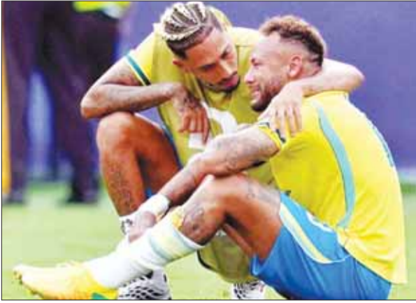
पेनल्टी पर गोल नहीं कर सका ब्राजील

कर्टनी वॉल्सा = महान तेज गेंदबाज वॉल्सा ने अपनी घातक गेंदबाजी से दुनिया भर के बल्लेबाजों में डर पैदा किया पर अपनी बल्लेबाजी में उनके नाम एक ऐसा अनचाहा रिकार्ड दर्ज है जिसे वह भूलना चाहेंगे। साल 1984 से 2001 तक चले अपने करियर में वॉल्सा रिकार्ड 43 बार शून्य पर आउट हुए। 132 टेस्ट मैचों की 185 पारियों में उन्होंने कुल 936